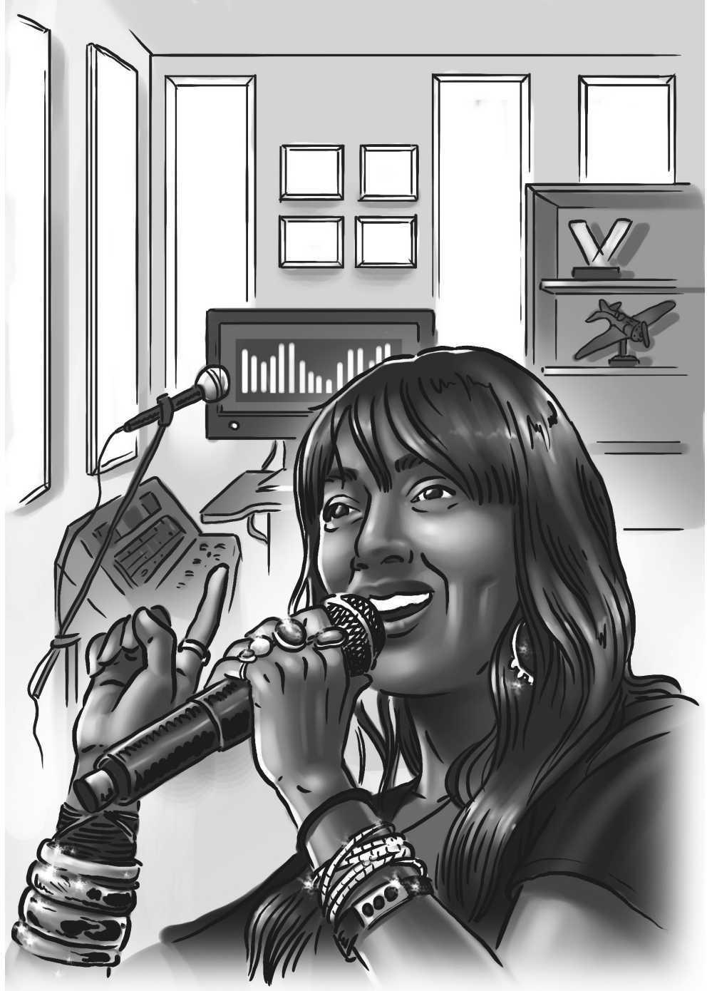
Hindi Zahra 1979