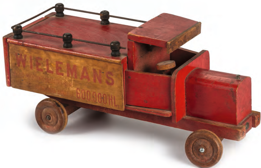
Speelgoedvrachtwagen Wielemans | jaren 1940 HET SPEELGOEDMUSEUM, BRUSSEL