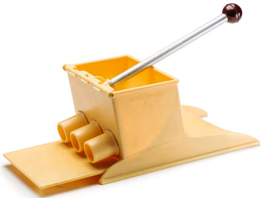
Millicroquettes, krokettenpers | Gaspard Thienpont, 1962 BELVUE MUSEUM, BRUSSEL