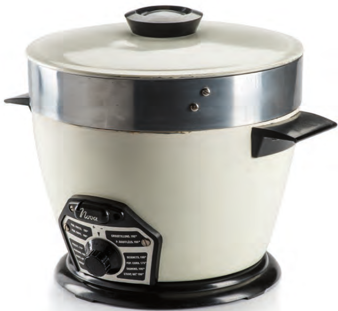
Elektrische frittuurpan | Nova, Tongeren, ca. 1955 DESIGN MUSEUM GENT