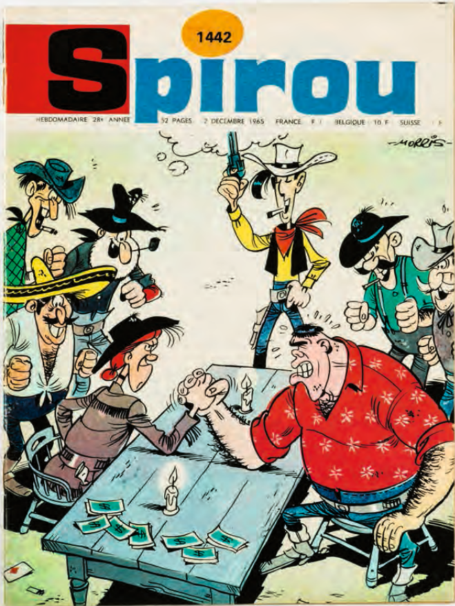
Weekblad Spirou (Robbedoes) met Lucky Luke van Morris op de cover | Dupuis, 1965