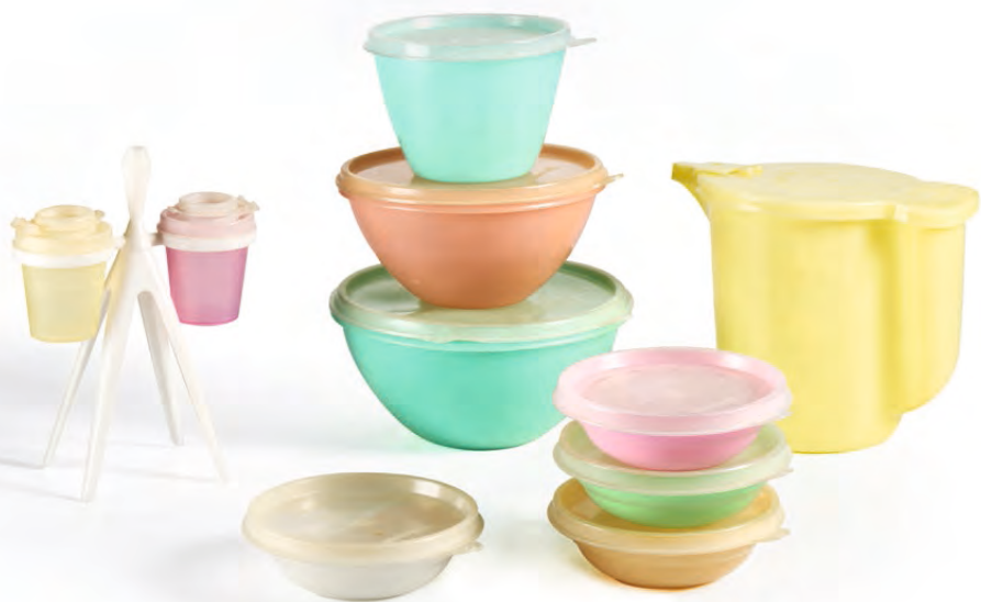
Bewaardozen, melkkan en peper-en-zoutstel | Tupperware, Aalst, jaren 1960 BELVUE MUSEUM, BRUSSEL