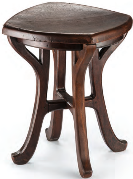
Krukje voor het 'Salon van de Grote Culturen' in het Paleis der Koloniën, Tervuren Georges Hobé, 1897

KONINKLIJKE MUSEA VOOR KUNST EN GESCHIEDENIS, BRUSSEL