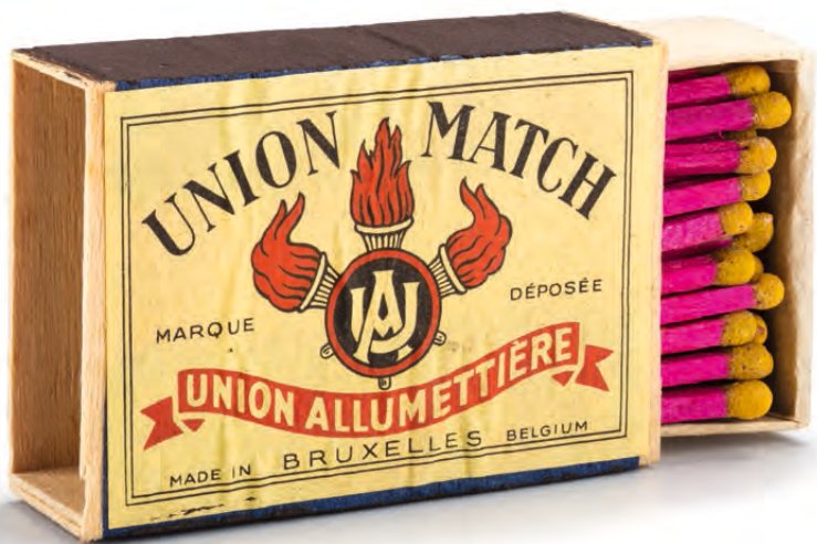
Luciferdoosje Union Match | ca. 1950-1960