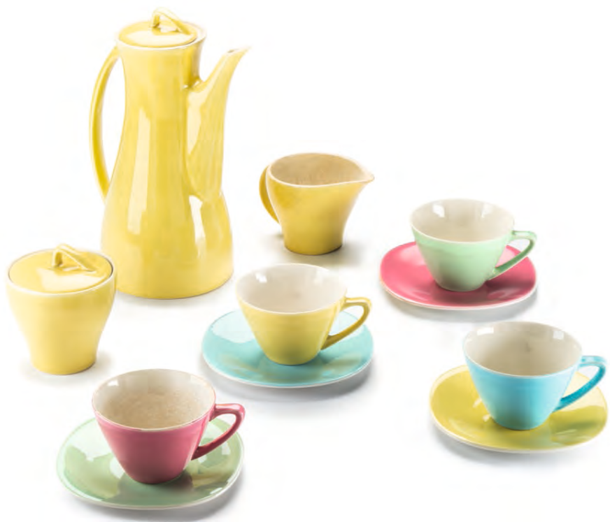
Koffieservies Saturne, decor Napoli | Boch Frères, ca. 1958 COLLECTIE KURT RIGOLLE