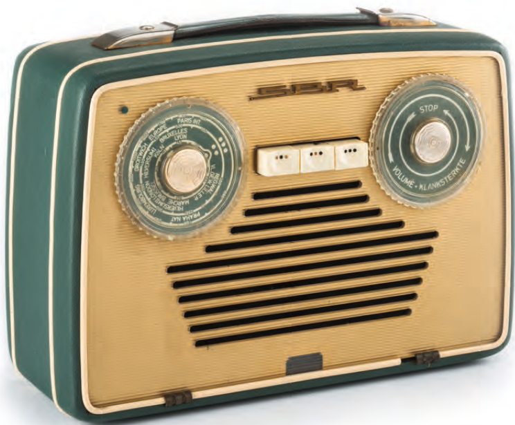
Draagbare radio Riviera | SBR Société Belge Radio-Électrique, Brussel, 1955 BELVUE MUSEUM, BRUSSEL