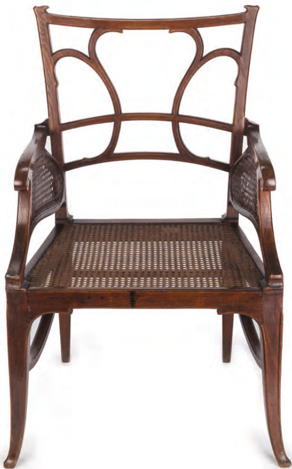
Armstoel voor het huis Winssinger | Victor Horta, 1894-1897