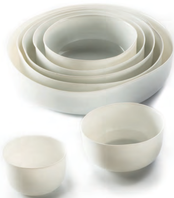
Set van zeven porseleinen schalen | Pieter Stockmans, 1987

BELVUE MUSEUM, BRUSSEL. SCHENKING STUDIO PIETER STOCKMANS, GENK-WINTERSLAG