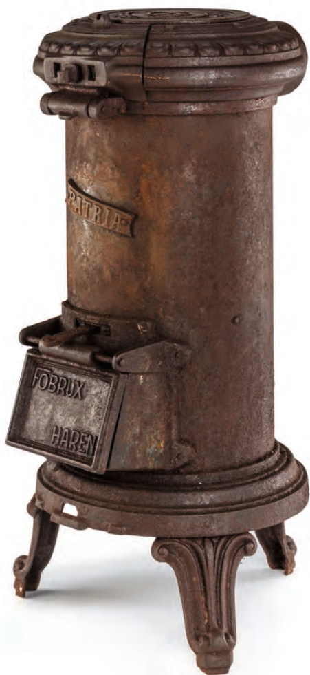
Patria, gietijzeren kolenkachel FobruX | Fonderies bruxelloises, Haren, ca. 1935

LA FONDERIE, MUSEUM VOOR ARBEID EN INDUSTRIE, BRUSSEL