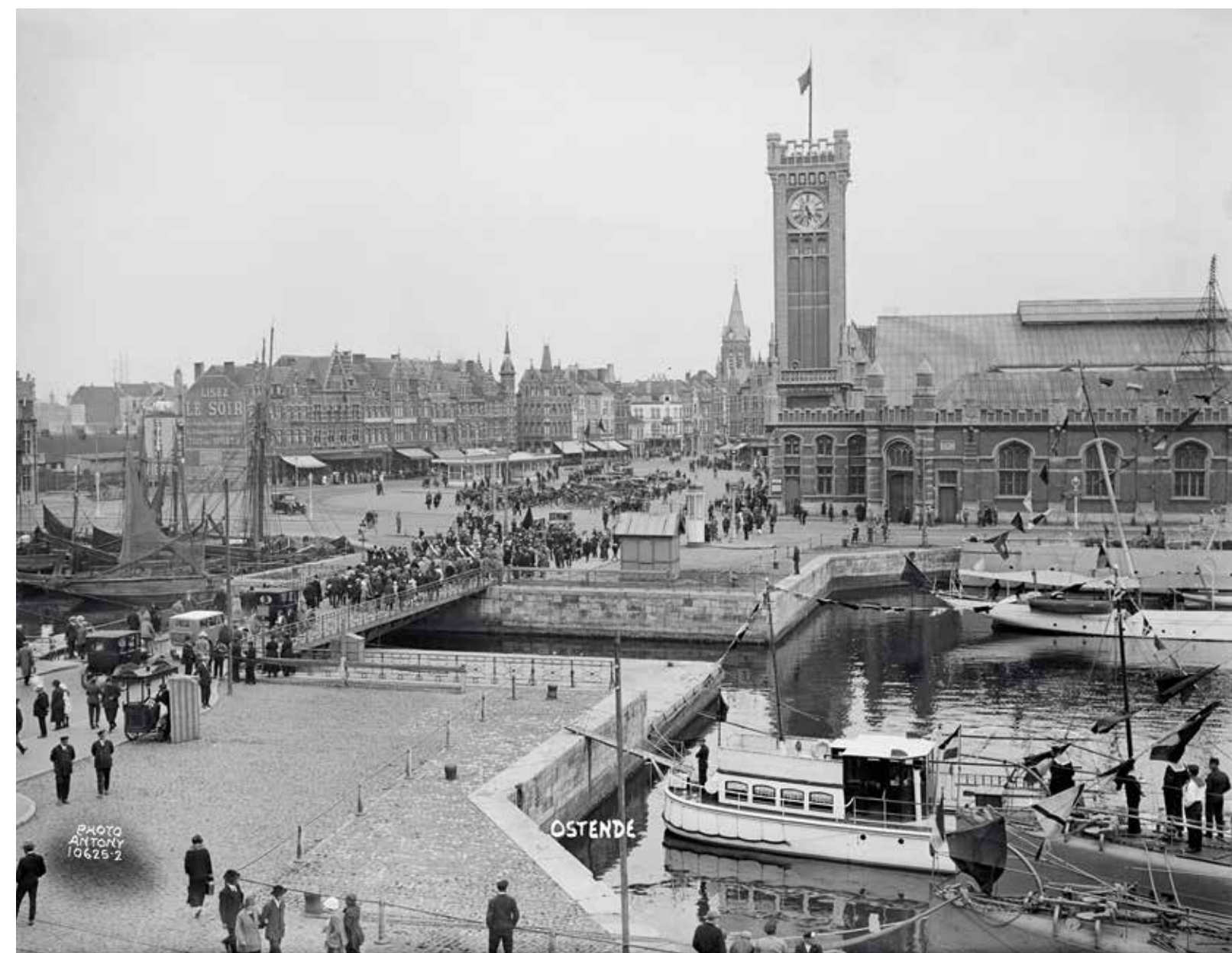
Zicht op het Tweede Handelsdok, de Kapellebrug, het oude station en de Hazegraswijk, 1 juni 1925