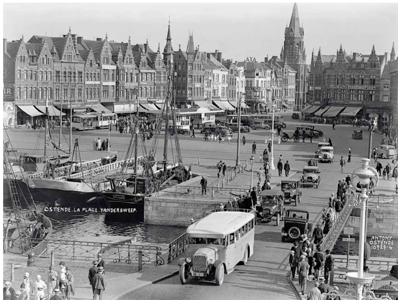
Zicht op het Vandersweepplein (het huidige Ernest Feysplein), met op de voorgrond de Kapellebrug en achteraan de kerk van Hazegras (afgebroken in 1995), 1 september 1929