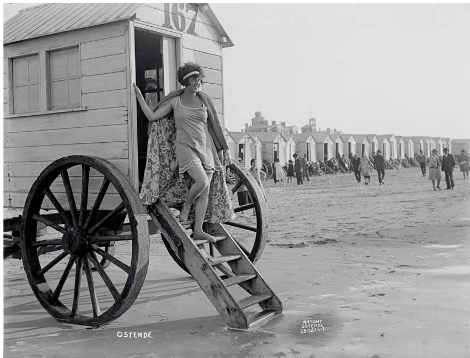
Baadster poserend op de trap van een badkar aan de waterlijn. Op de achtergrond is het Koninklijk Chalet te zien, 28 augustus 1926