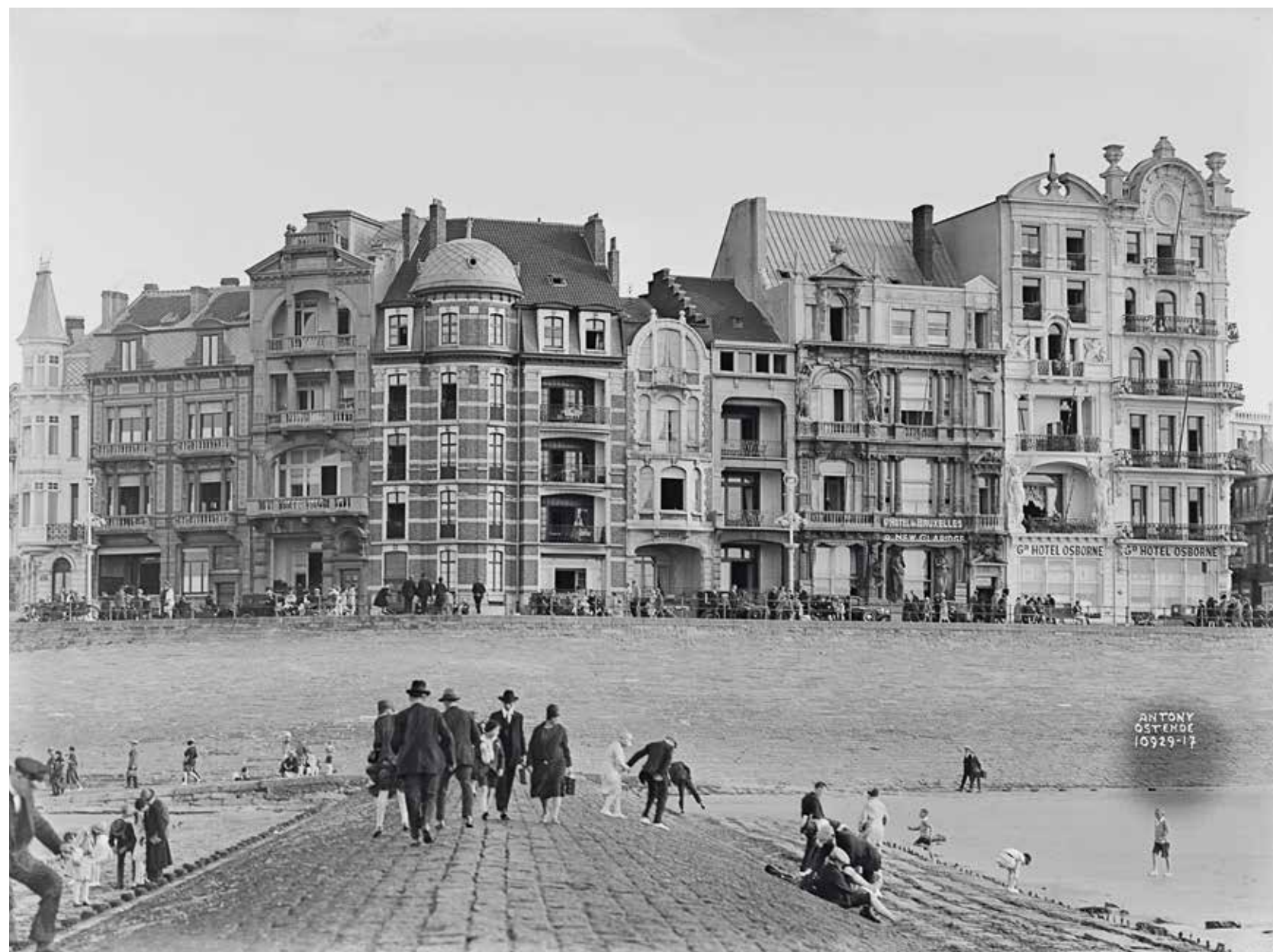
Zicht op de oostelijke Zeedijk, met het Hôtel de Bruxelles & New Claridge en het Grand Hôtel Osborne, 1 september 1929