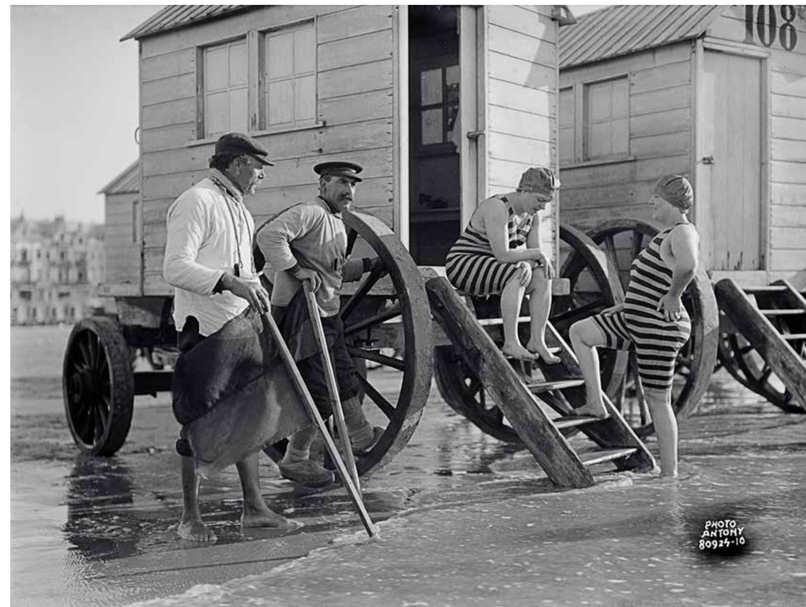
Baadsters en redders met vlag naast de typische Oostendse badkarren aan de waterlijn, 8 september 1924