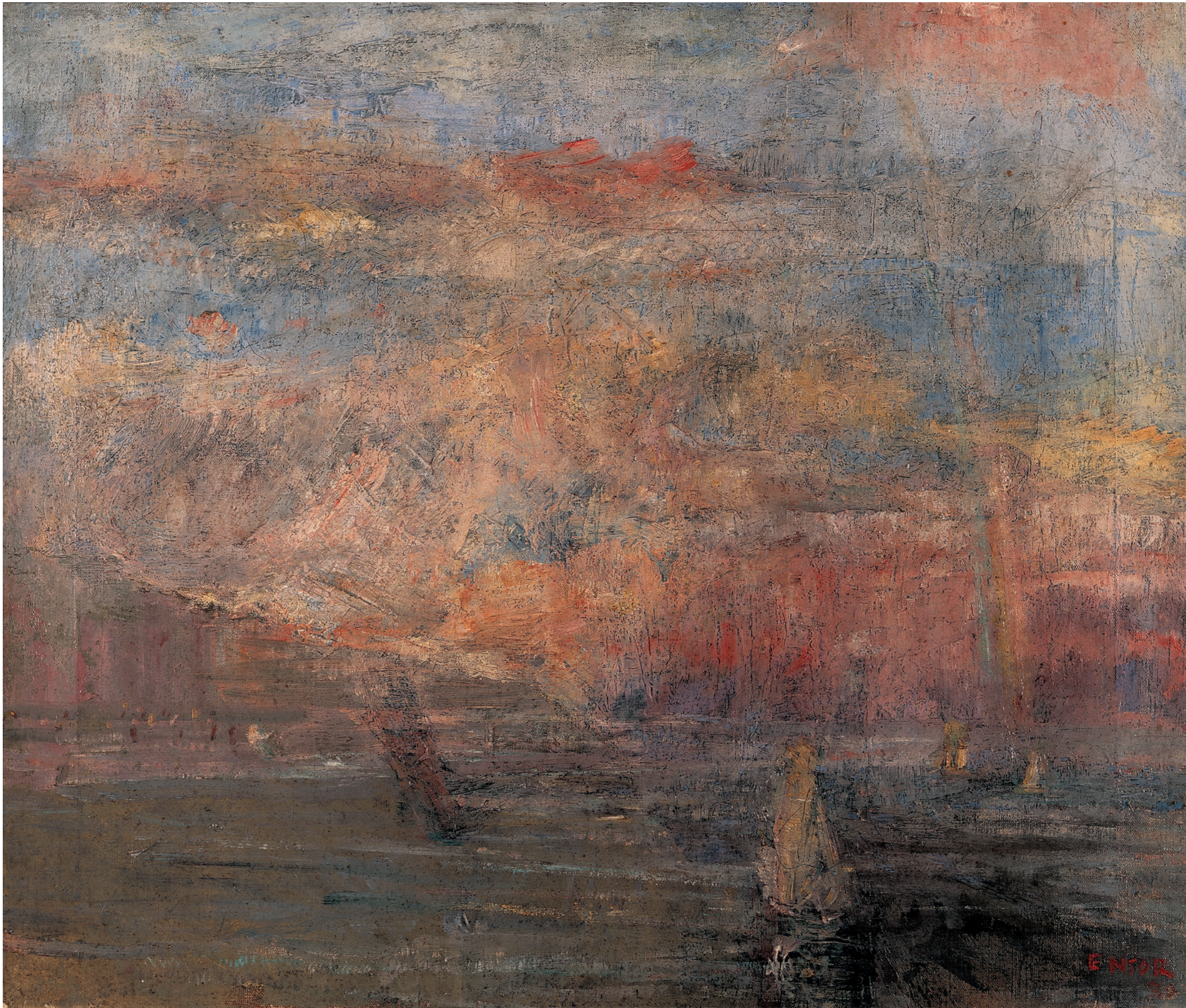
JAMES ENSOR, NA DE STORM (DE REGENBOOG OF DE ROZE WOLK), 1880