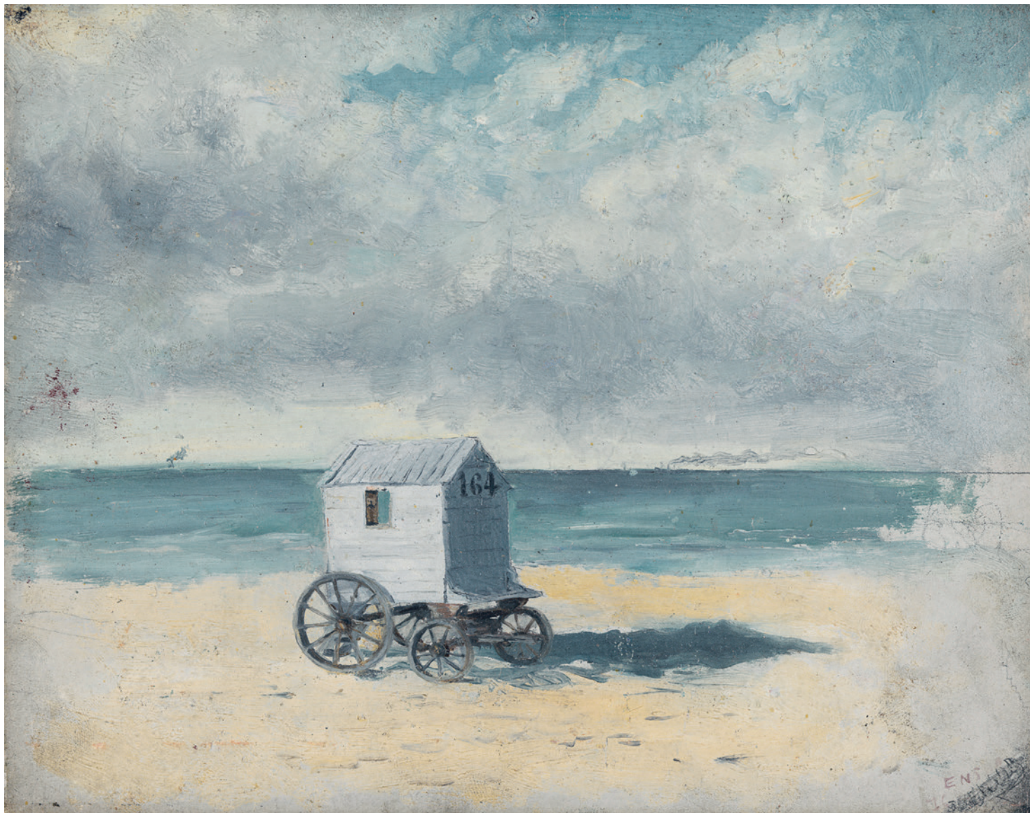
JAMES ENSOR, DE BADKOETS, 1876