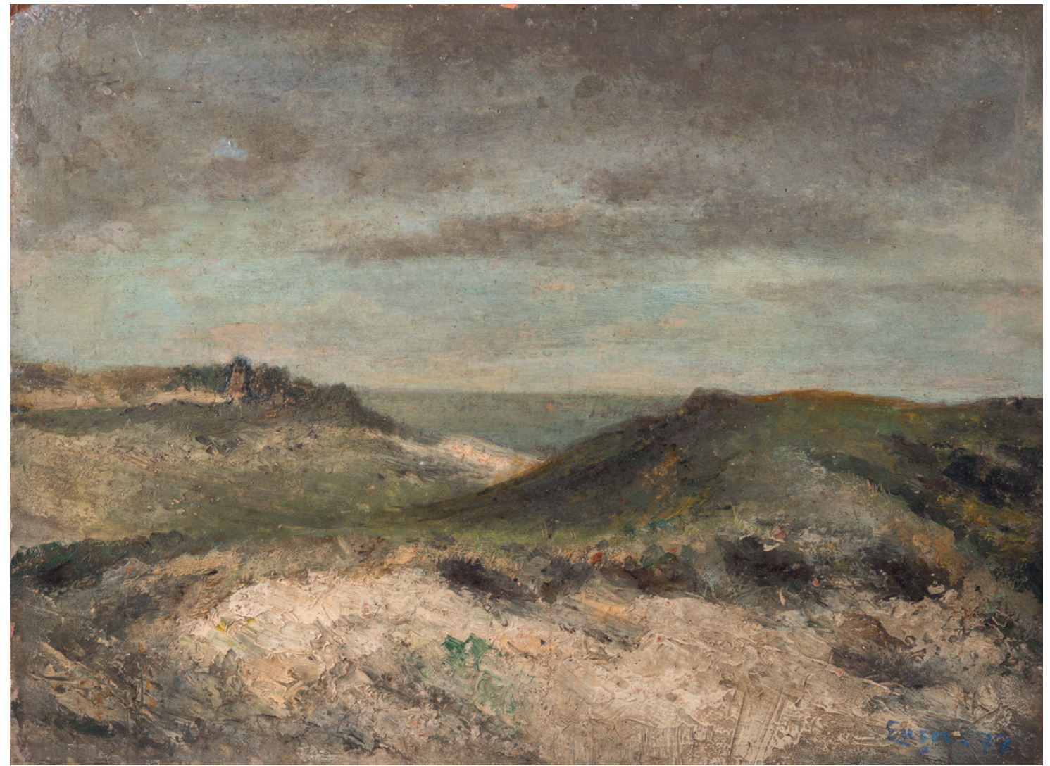
JAMES ENSOR, DUINEN, 1877