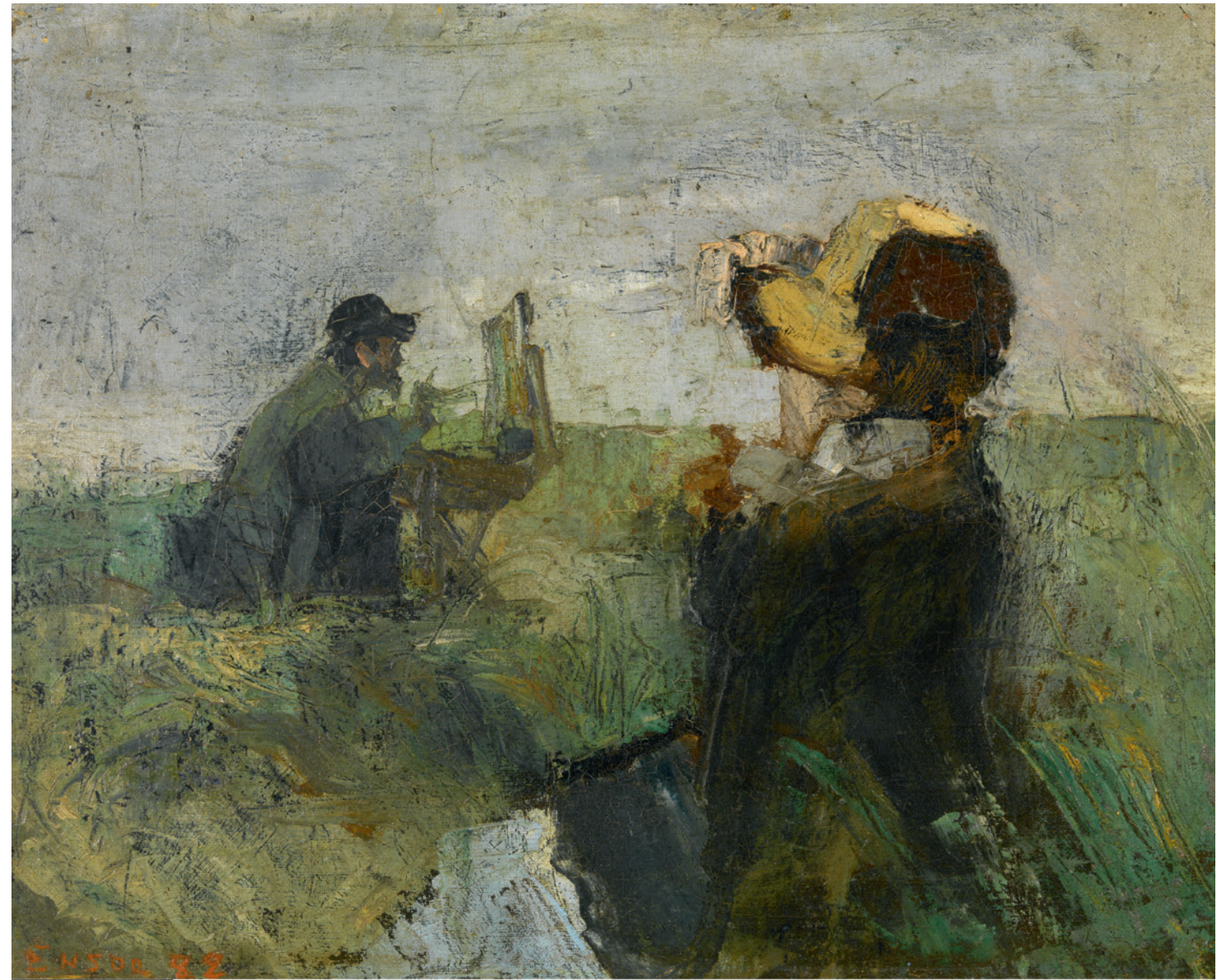
JAMES ENSOR, IN DE DUINEN (THÉO HANNON EN DAME), 1882