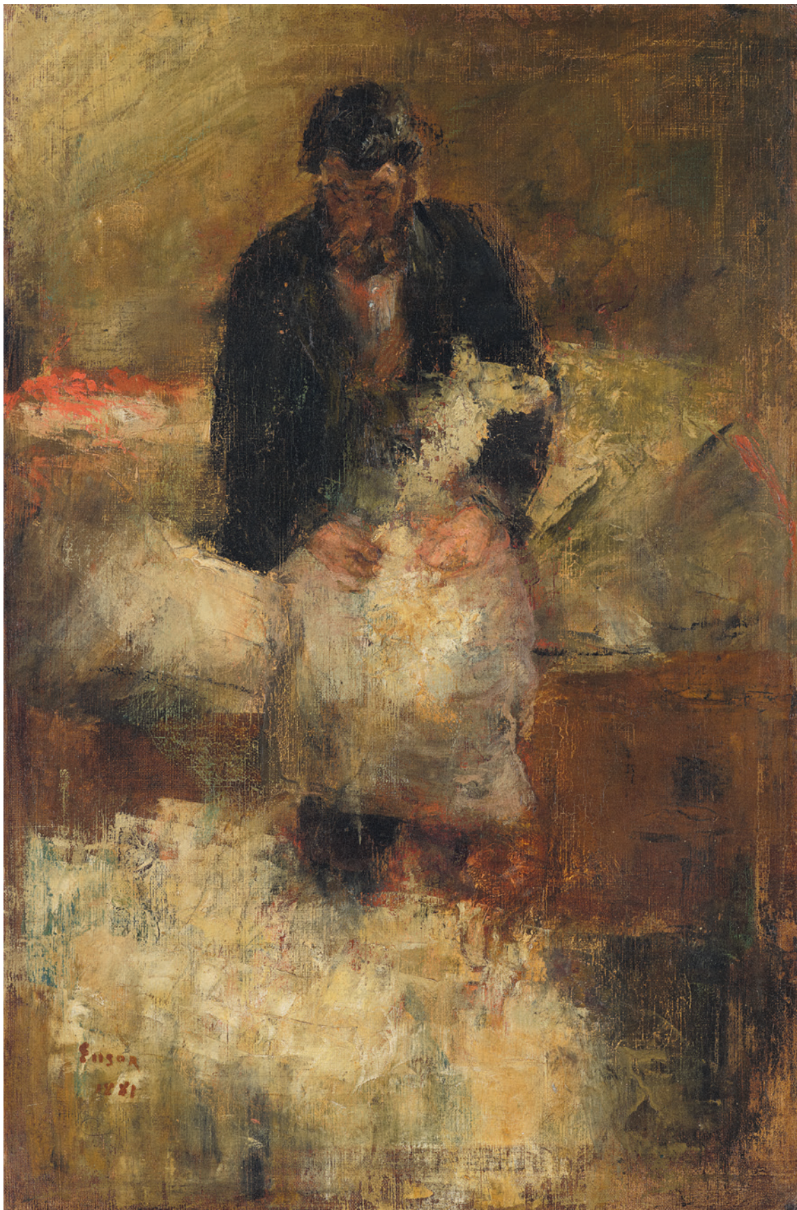
JAMES ENSOR, DE WOLKAARDER, 1881