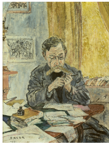
James Ensor, Portret van Emile Verhaeren , 1890. Koninklijke Bibliotheek, Brussel

in geestelijke verwaarlozing en de stilte. Ensor houdt daarvan ... Het leven in de haven is het enige leven in Oostende, in de winter. Het dringt de stad niet binnen; het bezielt alleen haar grenzen. ... / Ensor heeft deze uitgelatenheid vertaald in bijna sinistere werken die verbazen en beangstigen. De schilderachtigheid van de kleding, de versleten, afgedragen plunjes... de stomme koddigheid van het masker, de verveling die van de muren lijkt te sijpelen (...). 5