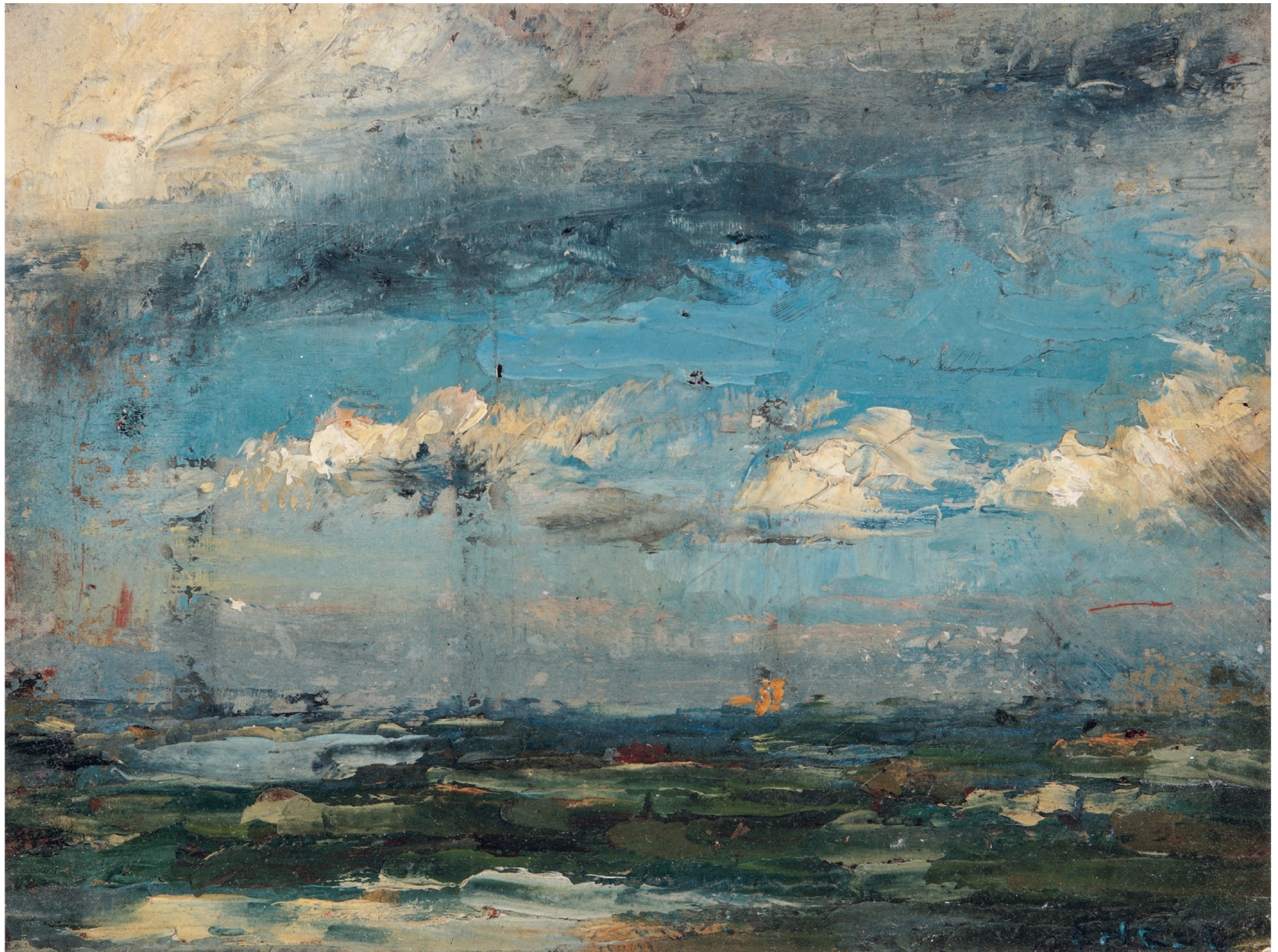
JAMES ENSOR, MARINE IN BLAUW, 1880