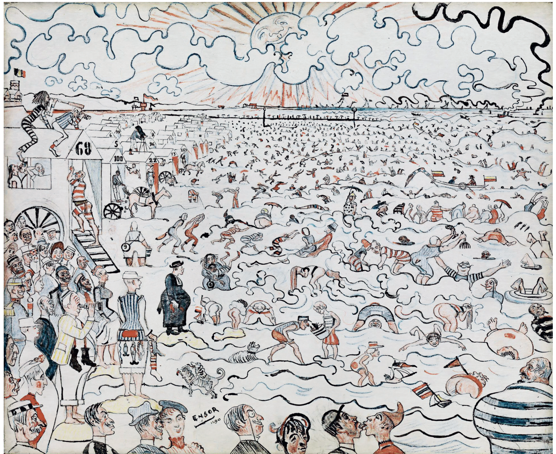
JAMES ENSOR, BADEN IN OOSTENDE, 1890