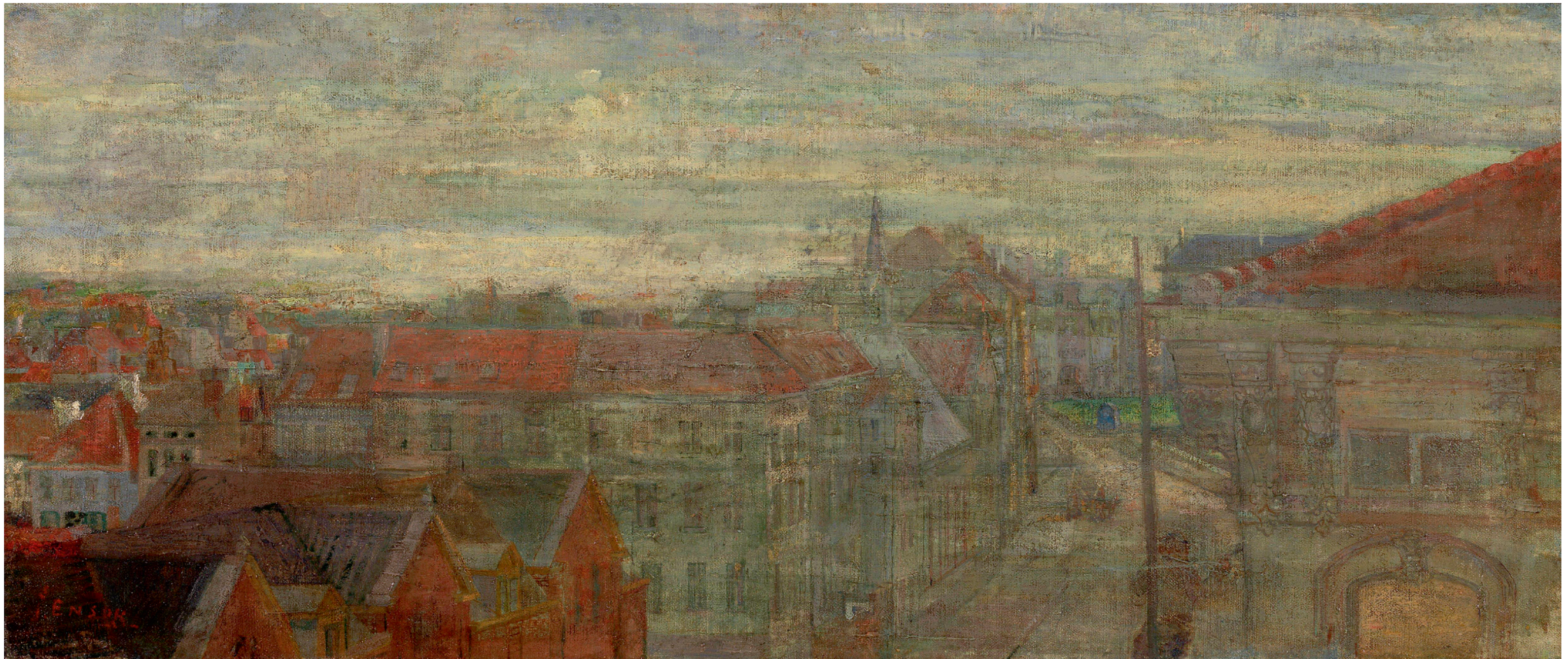
JAMES ENSOR, ZICHT VAN PHNOSIË. LUMINEUZE GOLVEN EN VIBRATIES, 1890