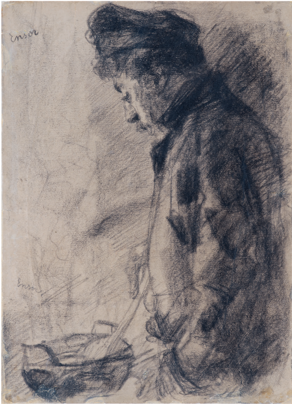
JAMES ENSOR, DE KOK, 1880