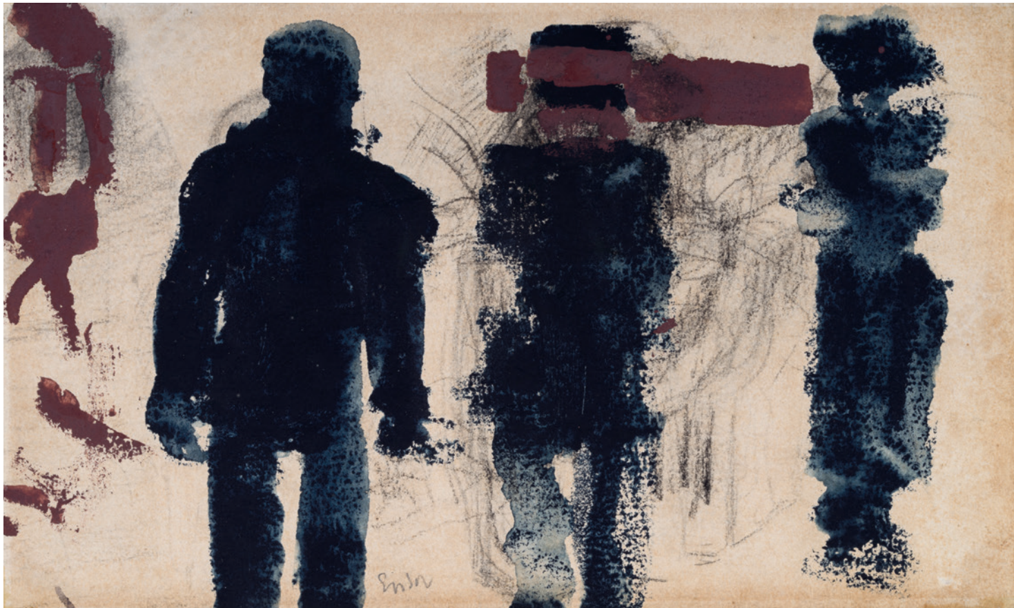
JAMES ENSOR, SILHOUETTES (VISSERS), CA. 1881