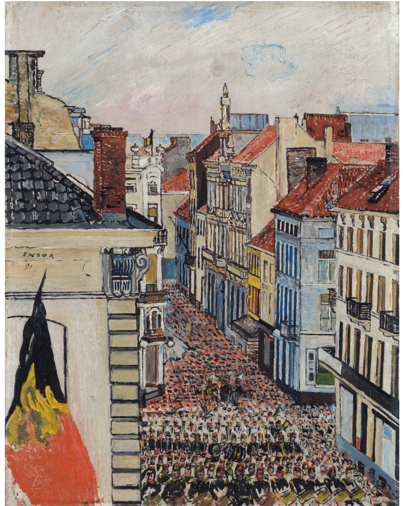
JAMES ENSOR, MUZIEK IN DE VLAANDERENSTRAAT, 1891