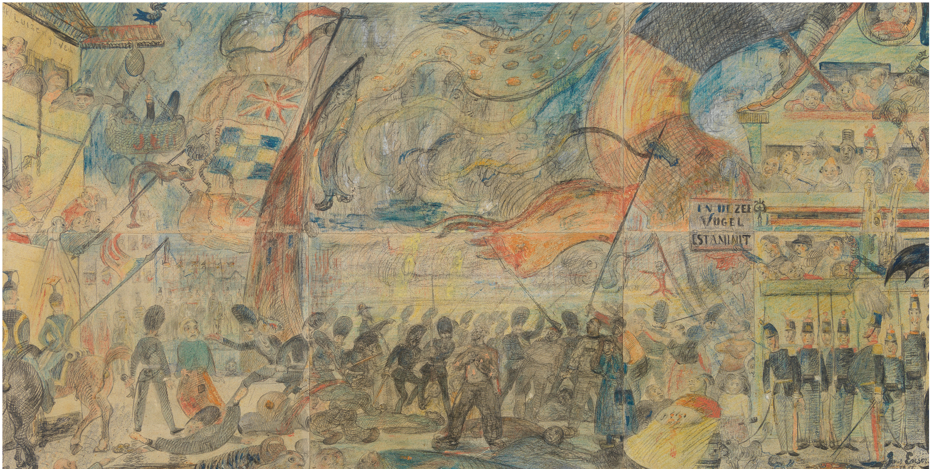
JAMES ENSOR, HET AFSLACHTEN VAN DE OOSTENDSE VISSERS (IN AUGUSTUS 1887) OF DE STAKING, 1888