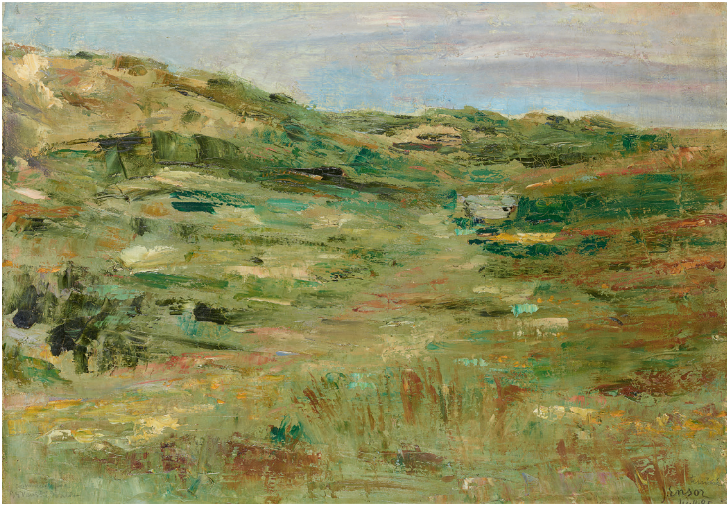
GUILLAUME VAN STRYDONCK EN JAMES ENSOR, DUINEN, 1885