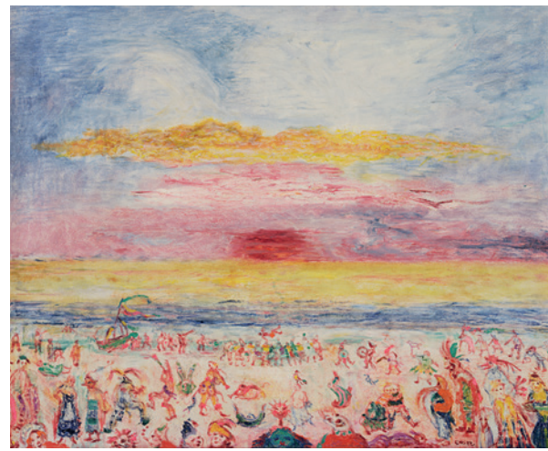
James Ensor, Carnaval in Oostende (op het strand) , 1933. Privécollectie

'In Oostende, een stad met een grillig klimaat, leeft Ensor in zijn echte fysieke klimaat, de natuurlijke omgeving waar hij voeding vindt voor zijn wortels en de bloemen van zijn fantasie. Zijn longen, zijn zenuwen, zijn hersenen zijn sinds zijn kindertijd doordrenkt van de Oostendse lucht, geïodeerd, marien, sprankelend van licht, gegeseld door de wind. De zeden van de stad, tussen het conventionele en het wilde, folkloristisch, kleinburgerlijk, groots of halfgaar, netjes gekleed, in een vissersblouse of in zwempak, die leerden de menselijke passies te beoordelen. De geest van de kunst wordt belichaamd door het vlees en het vlees van Ensors kunst is dat van zijn stad. Oostende maakt in meerdere opzichten aanspraak