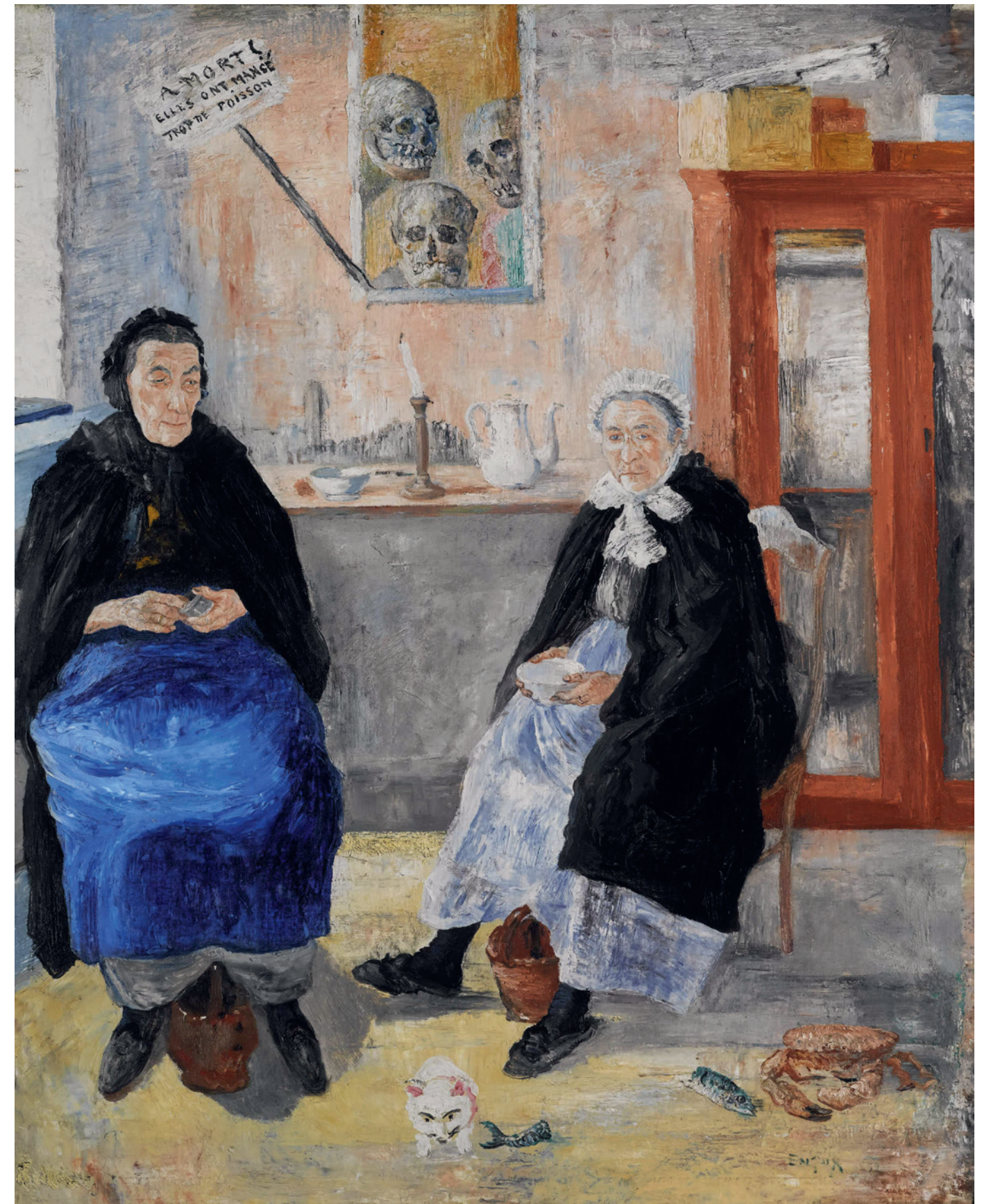
JAMES ENSOR, DE MELANCHOLISCHE VISSERSVROUWEN, 1892