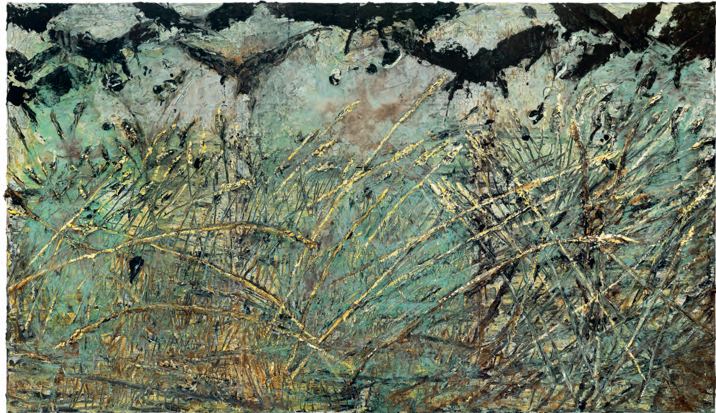
50 Anselm Kiefer Nevermore (Nooit weer) 2014 Emulsie, olieverf acrylverf, schellak, bladgoud en bezinksel van een elektrolyse op doek, 330 x 570 cm