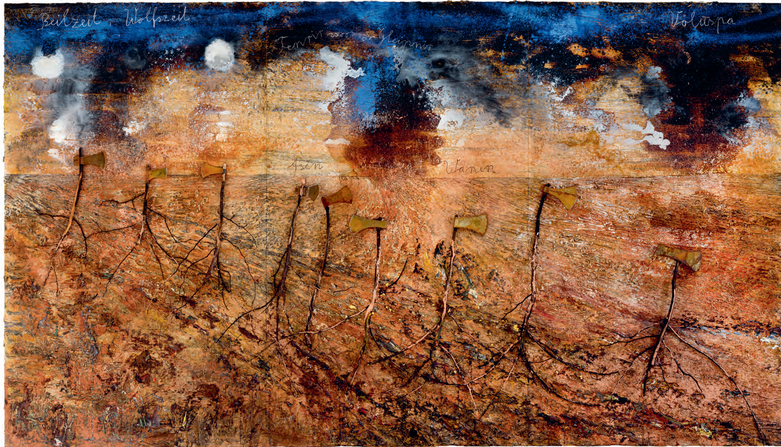
51 Anselm Kiefer Beilzeit - Wolfszeit (Bijtijd - Wolfstijd) , 2019 Emulsie, olieverf, acrylverf, schellak, hout en metaal op doek, 470 x 840 cm Collectie van de kunstenaar, courtesy Gagolian