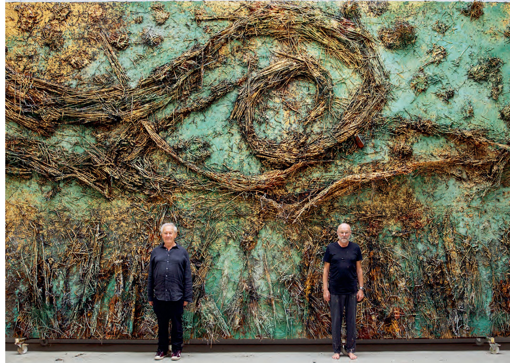
48 Simon Schama en Anselm Kiefer voor De sterrennacht , in Kiefers atelier in Croissy, juli 2024.

In Anselm Kiefers meest ambitieuze en fascinerende werken schuilen altijd diepgravende overpeinzingen over de onscheidbaarheid van leven en dood, van de aarde en de hemelkoepel, van microkosmos en macrokosmos, nieuwe wetenschap en oeroude kennis, duisterheid en openbaring. Zoals altijd werken de zintuigen en de geest samen om de maximale denkkraft aan te zuigen. Toch belemmert dit alles geenszins zijn bevlogen speelsheid. Toen ik in 2024 aan het eind van de lente met Kiefer over de oprit achter zijn atelier liep, hielden we halt op een plek waar een wolk van felgekleurde klaprozen stond te dansen in de zon naast een zonnebloem van hars en gips: levende en niet-levende bloemen die ontsproten aan een berg kapotgeslagen beton. Kiefer barstte uit in gegniffel zoals hij wel vaker doet: de lach van een magiër. Maar dat was niets vergeleken met zijn vreugdekreten toen hij zich over de scheuren in de oprit boog waardoorheen zich onkruid en mos naar het licht duwden. ‘Kijk!’, riep hij alsof we nog nooit zoiets hadden gezien en het niet zozeer te verwachten viel als wel begroet moest worden als een nieuw mirakel. Vincent van Gogh zou dat hebben begrepen.