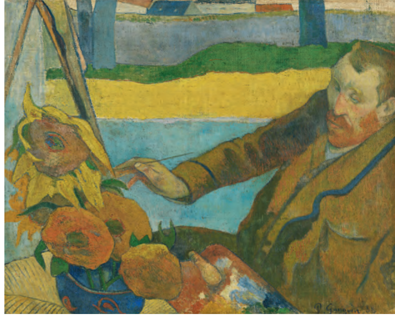
34 Paul Gauguin Vincent van Gogh zonnebloemen schilderend, 1888 Olieverf op doek, 73 × 91 cm Van Gogh Museum, Amsterdam (Vincent van Gogh Stichting)

deel uit van Van Goghs plannen voor een kring van schildervrienden om zich heen. Vóór de komst van Paul Gauguin begon hij koortsachtig zonnebloemen te schilderen met het idee er meerdere van op te hangen in het toch al felgele huis waarin hij in Arles vier kamers huurde. Naast de schilderijen wilde hij er ook vazen neerzetten gevuld met deze enorme bloemen (afb. 33). Hoe de relatie met Gauguin ook precies stukliep (Gauguins ongeduld botste met het artistieke temperament van Van Gogh), de zonnebloem-kant van de zaak schiep een band. Gauguins liefdevolle portret van Vincent als de ‘schilder van zonnebloemen’ lijkt me