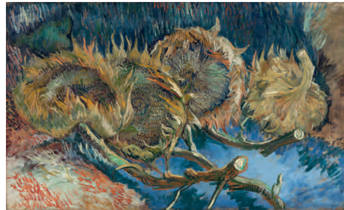
35 Vincent van Gogh Vier uitgebloeide zonnebloemen, 1887 Olieverf op doek, 59,5 × 99,5 cm Kröller-Müller Museum, Otterlo

Misschien is er één uitzondering. In augustus 1998 schrijft Kiefer in zijn aantekenboek: ‘een aquarel voltooid: zonnebloemen op een tafel’. Maar dan overvalt hem als altijd de twijfel over wat dit is en wat hij nu eigenlijk heeft gemaakt: ‘wat doe je met de zonnebloemen op een tafel als het geen stilleven is? want dit is geen stilleven, de zonnebloemen staan niet in een vaas en ze liggen niet op de tafel. ze staan ondersteboven in de grond, groeien verder in de grond op de tafel. en dus? zonnebloemen die op een tafel groeien, dat betekent allereerst dat ze pas halverwege beginnen. ze groeien niet vanaf de grond, maar vanaf ergens daartussen. je zou kunnen zeggen dat ze al boven-