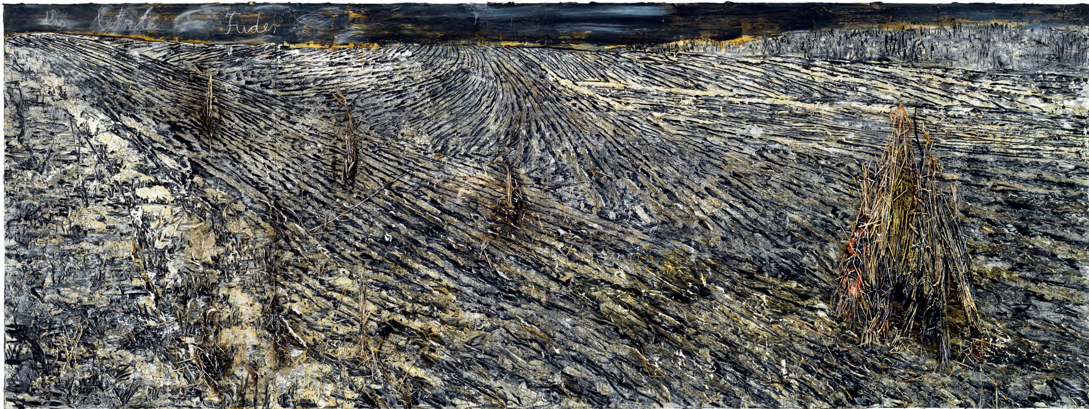
55 Anselm Kiefer Das letzte Fuder ( De laatste karrenvracht ), 2019 Emulsie, olieverf, acrylverf en stro op doek, 280 x 760 cm