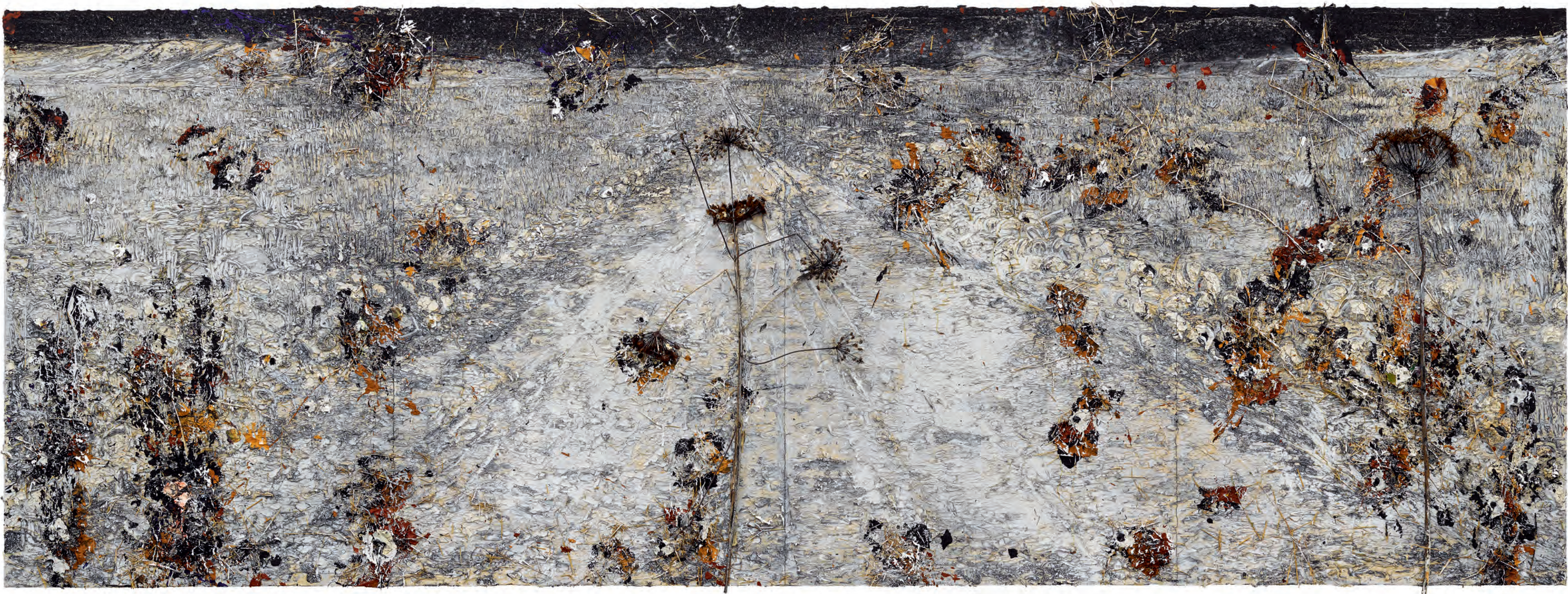
61 Anselm Kiefer Schierlingsbecher (Scheerlingbeker) , 2019 Emulsie, olieverf, acrylverf, schellak, staal, hout, lijm, stro en gedroogde planten op doek, 280 x 760 cm Collectie van de kunstenaar, courtesy White Cube