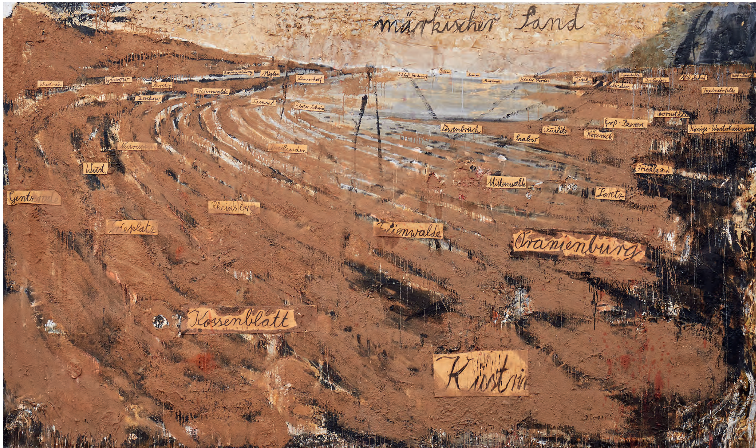
91 Anselm Kiefer Märkischer Sand , 1980-1982 Olieverf, acrylverf, emulsie, schellak, karton, houtskool en zand op fotopapier op doek, 330 x 555 cm Stedelijk Museum Amsterdam Verworven in 1982