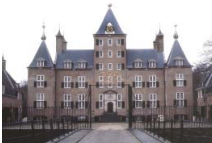
Kasteel Renswoude. 15 januari 1983.

Begin 1983 bezocht ik Renswoude voor het eerst. Mijn 'Historisch Dagboek' vermeldt: 'Op vrijdag 14 januari 1983 vertrok ik om 6 uur 's avonds vanuit Scheveningen met Henk Taets van Amerongen naar Renswoude (...) In een snelle Mercedes ging het richting Renswoude. Even buiten het dorp heeft Henk in een boscomplex een jachthuis, geheel van hout met een stenen schoorsteen en open haard, waar we ons behaaglijk installeerden. Dit huis ligt tegenover boerderij Wagensveld. Het wordt verwarmd door elektrische radiatoren, er is een flinke keuken met