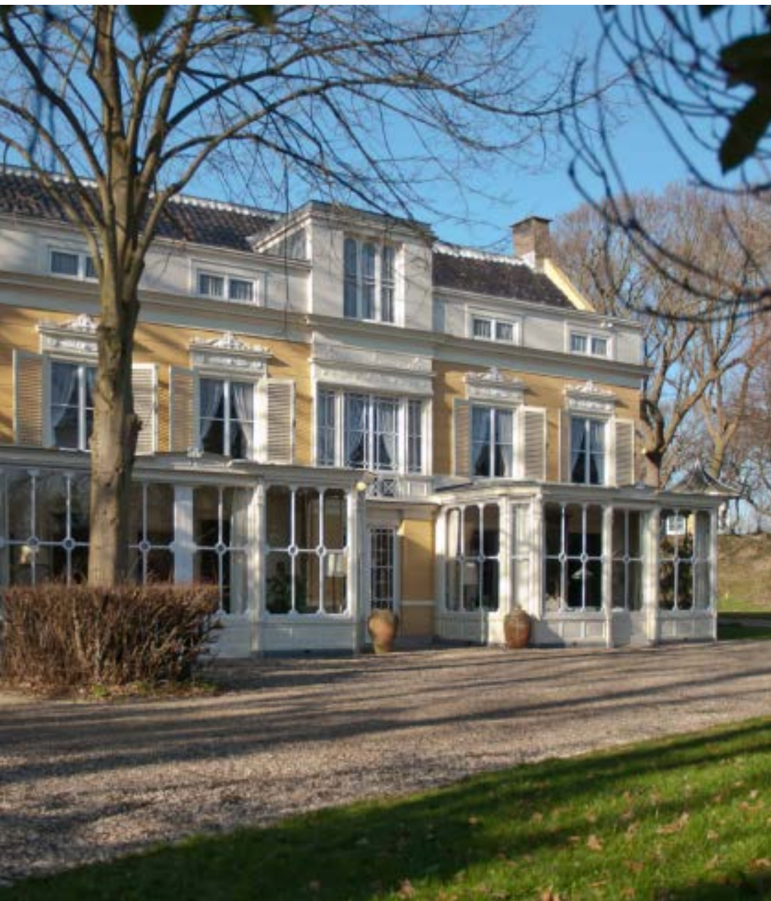
Recente foto van huize Calorama.