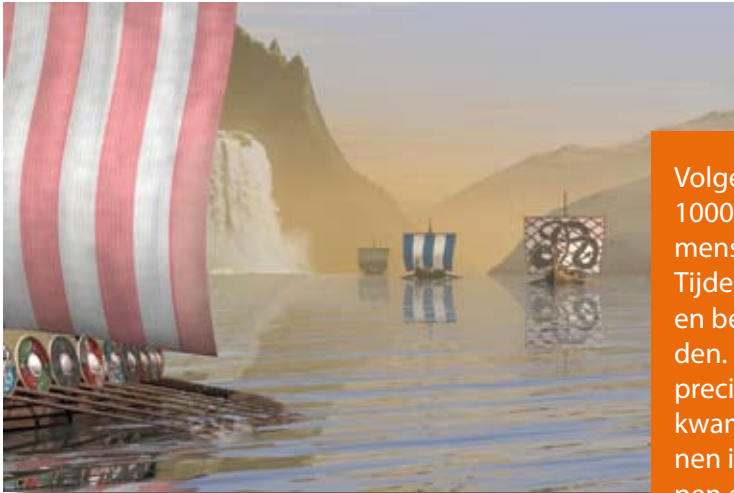
De ontdekking van Vinland

De eerste mensen trokken Noord-Amerika binnen over de Beringstraat. De Beringstraat is het stuk zee dat Alaska en Siberië van elkaar scheidt. Gedurende de ijstijd viel deze zeestraat droog en waren mensen in staat om vanuit Siberië naar Noord-Amerika te gaan. Het water in de Beringstraat zakte in die tijd 90 meter waardoor een 1600 kilometer breed grasland ontstond. Het huidige Canada was bedekt met gletsjers die verhinderden dat de eerste mensen dieper landinwaarts trokken. De gletsjers begonnen te smelten en de Beringstraat vulde zich weer met zeewater. De weg naar de rest van het Amerikaanse continent lag nu open.