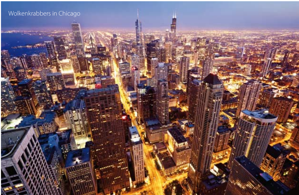
Wolkenkrabbers in Chicago

Als we aan de Verenigde Staten denken, komen er verschillende beelden bij ons op. Zoals het Vrijheidsbeeld, het Witte Huis, grote winkelcentra, de prachtige landschappen en eindeloze snelwegen. Ook denken we aan de enorme wolkenkrabbers en de Amerikaanse schoolbus.