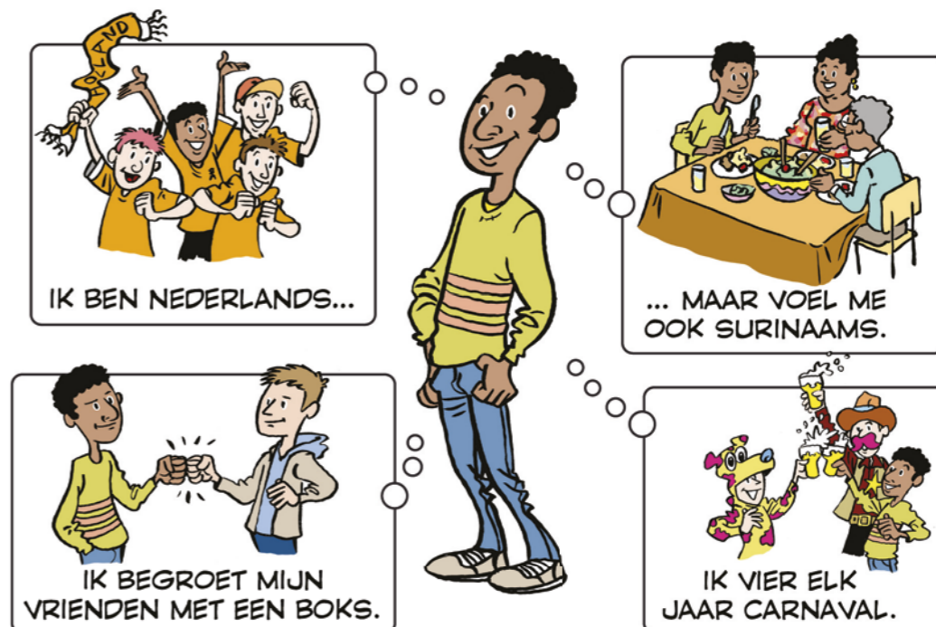
Je kunt je met verschillende culturen verbonden voelen.

Mensen met een gemeenschappelijke cultuur voelen zich vaak met elkaar verbonden. Dit komt onder andere omdat ze bepaalde gewoonten delen, zoals eetgewoonten of de gewoonte om elkaar op een bepaalde manier te begroeten. Gewoonten die van de ene op de andere generatie worden doorgegeven, noem je tradities . Een voorbeeld van een traditie binnen de Nederlandse cultuur is het vieren van Sinterklaas.