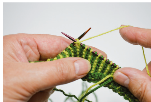
Boord breien met twee kleuren

Is de boord veel te wijd, neem dan een dunner