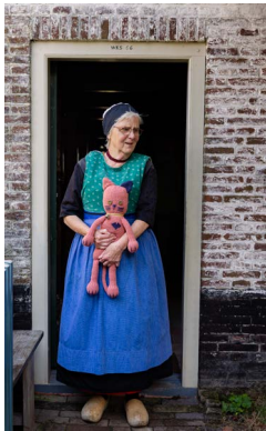
8 Numi the cat