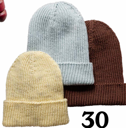
28 Hebbedingen & handigheden