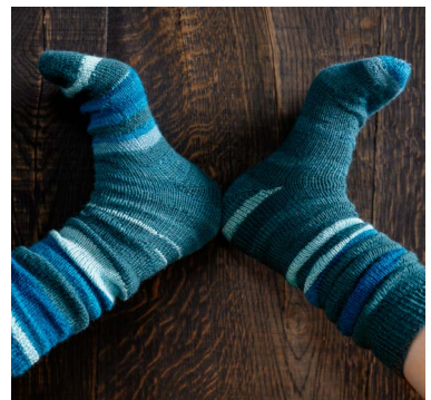
46 Lente socks