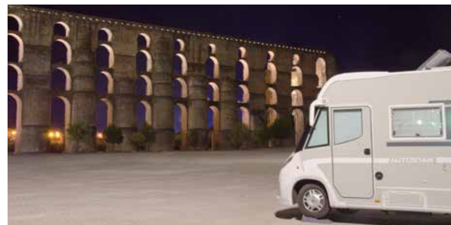
Camperplaats bij Elvas met uitzicht op het aquaduct

Vanuit Pomarinho nemen we de N246 naar Elvas, dicht bij de grens met Spanje, waar we een prachtige camperplaats vinden. We staan hier op een groot parkeerterrein aan de rand van een heuvel die beplant is met