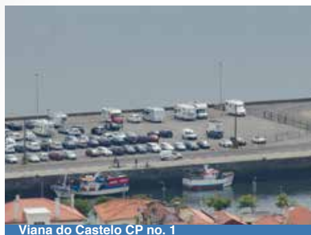
Viana do Castelo CP no. 1

Parkeerterrein bij de rivier. Je wandelt in 5 minuutjes naar de stad en de donderdagmarkt. Voor de markt moet je woensdag vroeg een plek zoeken. Op donderdagochtend is het verkeer richting het stadje een gekkenhuis. Wij kwamen volledig vast te zitten in de files. We vonden een plekje omdat er net iemand wegging.