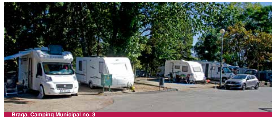
Braga, Camping Municipal no. 3

Gemeentecamping aan de rand van de stad, in heuvelachtig terrein. Meeste plekken zijn alleen geschikt voor tenten. Langs een rand (redelijk steil weggetje) zijn wat mooie plekken maar die zijn zeker niet geschikt voor campers langer dan ca. 6 meter. Bovenaan het terrein zijn plekken voor ca. 7 à 10 campers ingericht direct bij de weg (achter een muur) en daar is aardig wat verkeer. Desondanks wel een fijne camping om de stad en Bom Jesus te bezoeken (naar het centrum met de bus max 10 minuten, dan Bom Jesus, bus 2, maximaal 20 minuten). Lopen naar het centrum kan ook, je wandelt in ca. 20 minuten naar beneden/centrum. Sanitair is matig, douche-ruimtes krap, wel lekker warm water. Je mag gebruik maken van het zwembad dat onderaan de camping ligt. Honden toegestaan. Niet geschikt voor gehandicapten.