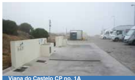
Viana do Castelo CP no. 1A