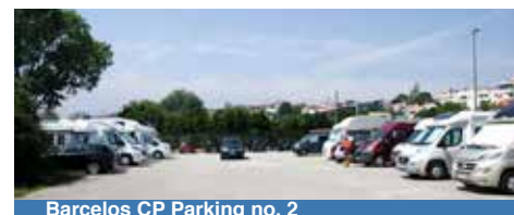
Barcelos CP Parking no. 2