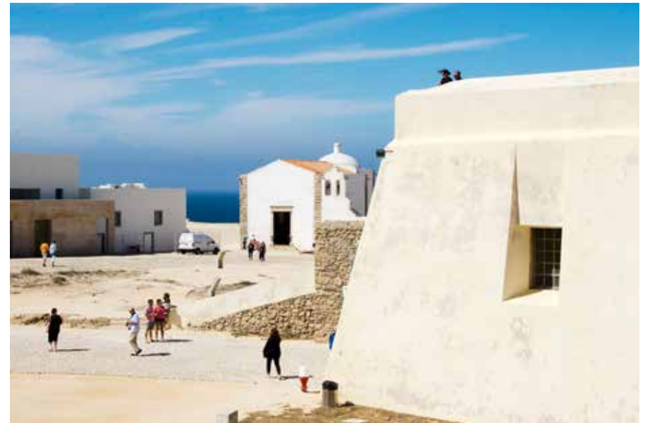
Historische plek: hier leerde Hendrik de Zeevaarder de latere ontdekkingsreizigers navigeren. De kapel is het enige overgebleven gebouw uit zijn tijd