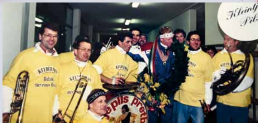
Rintje Ritsma veroverde in Baselga zijn eerste wereldtitel, en dat moest natuurlijk gevierd worden.

schaatswedstrijd in Italië zal zeker niet bij deze ene keer blijven", zo liet de Italiaan weten. En hij hield woord.