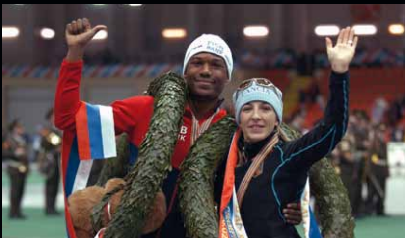
De wereldkampioenen 2005: Anni Friesinger en Shani Davis.