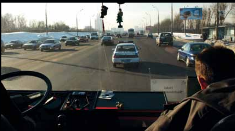
Kleintje Pils werd onder politiebegeleiding met de bus naar het ijsstadion gebracht.