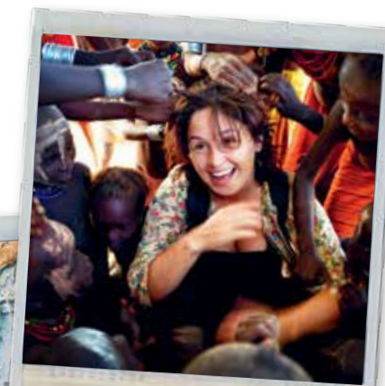
Banna, Hamar, Karo, Dassanech, Mursi & Arbore