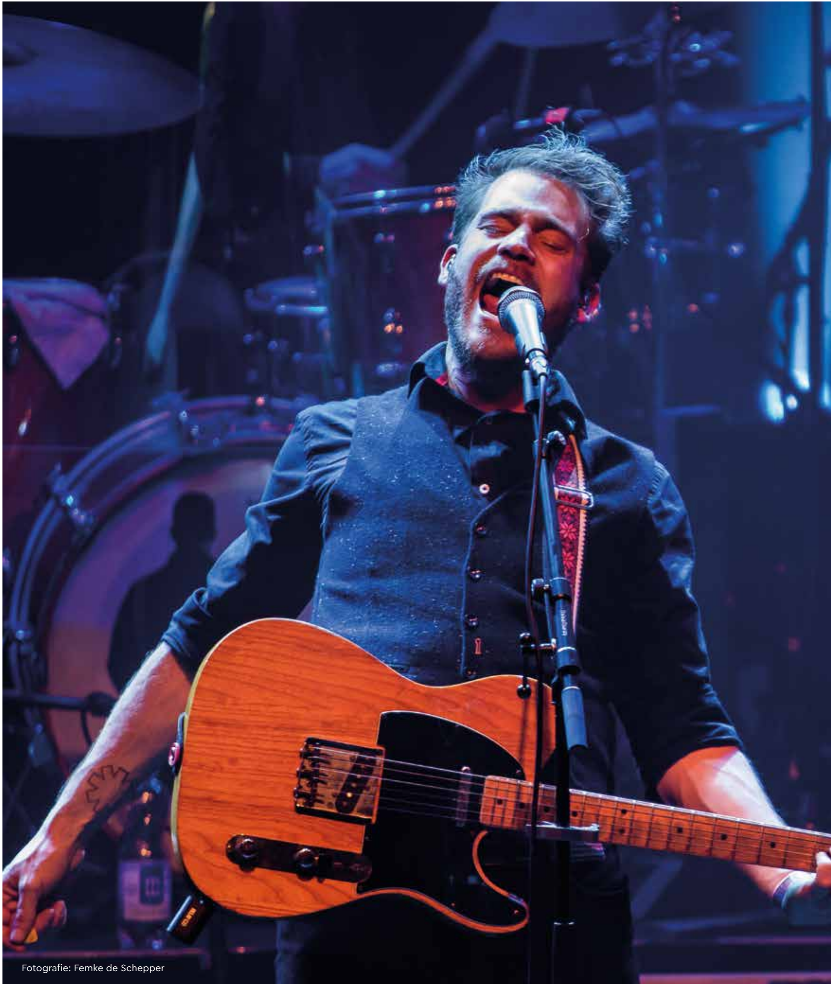
Fotografie: Femke de Schepper