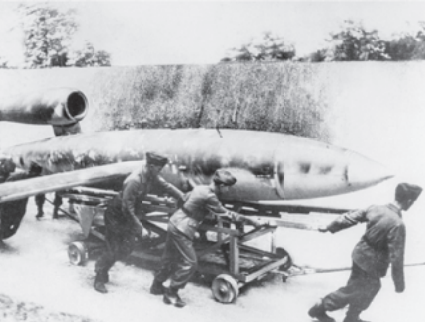
Een V1 wordt naar de lanceerhelling gevoerd.

OFFICIËLE BENAMING: Fieseler Fi 103 of codenaam Flakzielgerät (FZG-76)