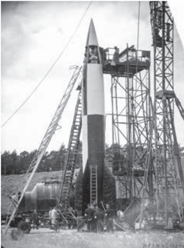
Een V2 in de proefopstelling in Peenemünde.

sen september 1940 en mei 1941 niet het gewenste effect gehad. Reeds in maart 1941 gaf Hitler de hoogste prioriteit aan het raketonderzoek, een teleurstelling voor de Luftwaffe, die aan autoriteit had ingeboet na de blitzkrieg op Engeland. Eind augustus 1941, twee maanden na de Duitse inval in de Sovjet-Unie, toonde Hitler zich opnieuw enthousiast over wat er in Peenemünde gebeurde. Walter Dornberger hoorde de Führer zelf zeggen dat de wapens ‘revolutionair waren en de manier van oorlogsvoering wereldwijd zouden veranderen’. Hitler besloot dat ‘het dom zou zijn er slechts enkele duizenden te produceren’. Hij droomde er hardop van dat er ‘per jaar honderdduizenden raketten geproduceerd en gelanceerd zouden worden’. De bommen op steden als Lübeck waren hooguit een duwtje in de rug, een handigheid in de Duitse propaganda.