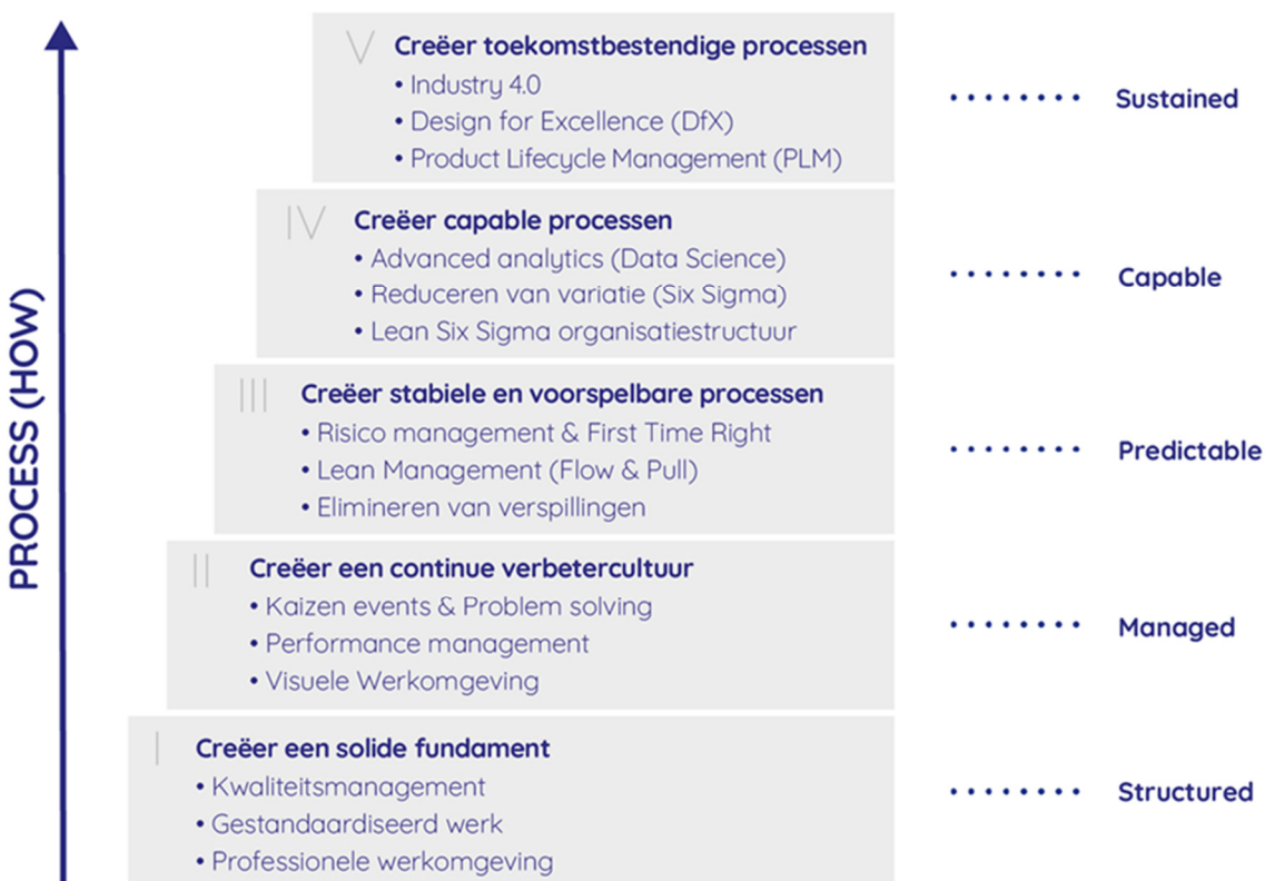
Figuur 5 – Eerste CIMM-as: ‘Procesverbetering’; Process (WHAT)

De methode voor continue verbetering, die het beste bij een bepaalde organisatie past, hangt sterk af van het volwassenheidsniveau van die organisatie. Dit geldt ook voor de bijbehorende principes en technieken. Om organisaties te ondersteunen bij het toepassen van de best passende verbetermethodiek, heeft de LSSA het ‘Continuous Improvement Maturity Model’ (CIMM™) ontwikkeld. CIMM vat alle beste practices en technieken van verschillende methodes samen in één raamwerk, voor verschillende volwassenheidsniveaus. Het CIMM-raamwerk moet zoveel mogelijk sequentieel worden doorlopen. Het wordt niet aangeraden om te snel door te gaan naar de hogere CIMM-niveaus als de lagere niveaus onvoldoende ontwikkeld en geborgd zijn. Het heeft bijvoorbeeld geen zin om statistische technieken toe te passen voor het verminderen van variatie, zolang processen nog niet stabiel en voorspelbaar zijn.