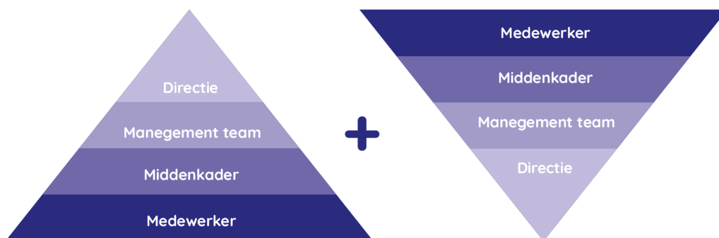
Figuur 4 – Omgekeerde piramide

Deze bottom-up benadering zal de flexibiliteit en productiviteit voor het oplossen van problemen verbeteren, in het bijzonder voor de zogenaamde 'laaghangend fruit' projecten waar geen noodzaak is van betrokkenheid van het management om tot oplossingen te komen. Problemen worden namelijk opgelost door de medewerkers die deze problemen zelf elke dag ervaren. Daarmee is het in hun eigen voordeel dat deze problemen worden opgelost, omdat het hun werk gemakkelijker maakt. De medewerkers op de werkvloer hebben de creativiteit en ideeën om de problemen op te lossen, maar binnen een traditionele organisatie worden ze vaak niet betrokken of aangemoedigd om dat ook te doen. Je hoort dan vaak: "Ik heb het ze al zo vaak gezegd hoe het anders kan, maar er gebeurt niets." Een ander voordeel van de bottom-up benadering is dat de gehele organisatie wordt betrokken bij het verbeterproces, in plaats van dat projecten worden uitgevoerd door een kleine groep.