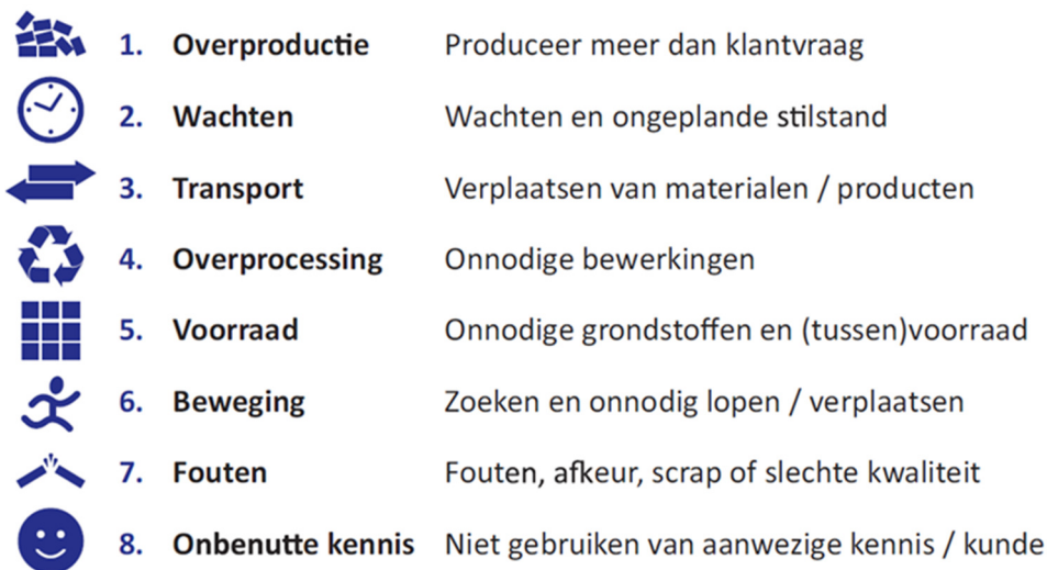
Figuur 2 – Muda: acht vormen van verspilling

Binnen Lean is het identificeren en elimineren van verspillingen één van de belangrijkste activiteiten. Verspillingen worden ook wel Waste of Muda genoemd. We onderscheiden acht vormen van verspilling, die zijn benoemd in onderstaande figuur. In hoofdstuk 6 zullen we uitgebreid ingaan op technieken om verspillingen te elimineren.