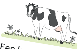
Een koe in de wei .

Soms kun je een woord met ei en ij schrijven. Ze klinken hetzelfde, maar ze betekenen wat anders.