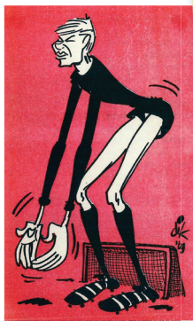
VAN VIANEN - HOLL. SPORT