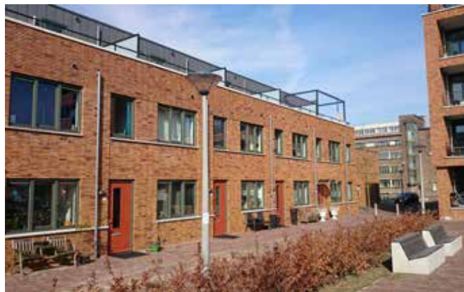
Speelstraat, herbestemming Nieuwe Kadegebied Arnhem, projectontwikkeling Volkshuisvesting en Kuiper Arn