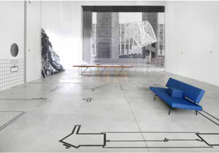
De expo 'EUtopia - Mogelijkheid van een eiland' in Museum M Leuven stelt de vraag naar de utopie in de architectuur. Hoe kunnen we het utopisch denken inzetten voor het bouwen aan een betere stad en samenleving? Vijf teams van vooraanstaande Belgische architecten en kunstenaars maken utopische ontwerpen voor het fictieve eiland EUtopia, een spiegel van onze Europese conditie. Curatoren Joeri De Bruyn & Ward Verbakel (2016)

bedriegen in hun eigen belang. 1 Bij Utopia gaat het niet om de vraag of je de heilstaat wel bereikt, maar om hoe je die bereikt en welke wegen daartoe leiden. Daarin moet dan een goede balans zijn tussen het collectieve belang en de individuele vrijheid. De politiek moet in functie van de moraal staan en samen moet je vorm geven aan de samenleving. Van een Utopia mag je dromen, maar je mag het niet opleggen. Door het gebruik van geweld veroorzaak je de ondergang. Het is ook een fictie om te denken dat je de menselijke natuur met een Utopia zou kunnen veranderen.