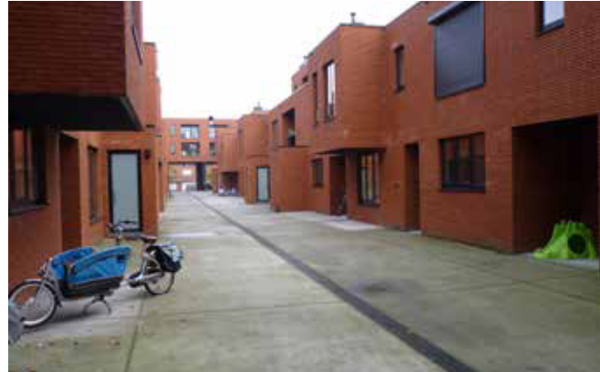
Speelstraat, herbestemmingsgebied Centrale Werkplaatsen Leuven, projectontwikkelaar: Matexi

Dat is niet vreemd. De Belg woont graag ruim. De gemiddelde woongrootte in België bedraagt 130 vierkante meter. De Nederlanders zijn tevreden met een goede 70 vierkante meter. De overblijvende bouwgronden in Vlaanderen zijn schaars, duur en veel kleiner dan twintig jaar geleden, terwijl de woningen te groot zijn geworden voor de veel kleinere huishoudens. De demografische, culturele en ruimtelijke factoren hebben ervoor gezorgd dat de huidige Vlaamse maatschappij deze woondroom al een aantal