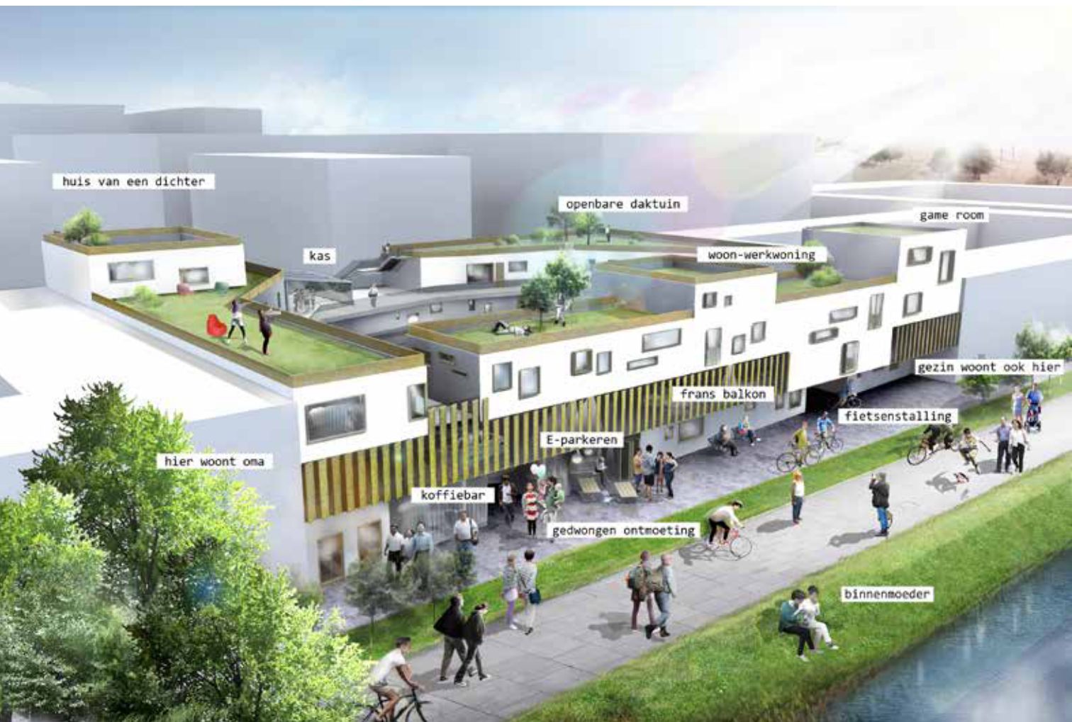
Hedendaags hofje © bureau SLA 1