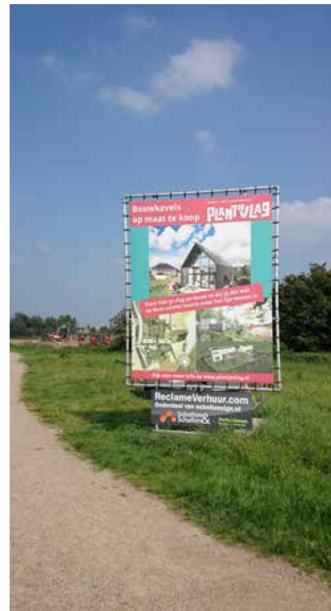
Zelfbouwwijk Plantje Vlag Nijmegen

De bovenstaande leeftijdsindeling moet je niet te nauw nemen. Ze is uitsluitend bedoeld om je een indruk te geven van het feit dat bij iedere levensfase wel een of meer woonvormen passen. Je hebt wat te kiezen. Maar soms neemt het leven een andere wending en dan kun je op je vijfenvijftigste al behoefte hebben aan een woonservicegebied. Of een kangoeroe- of mantelzorgwoning voor je kind met een beperking of je autistische broer.