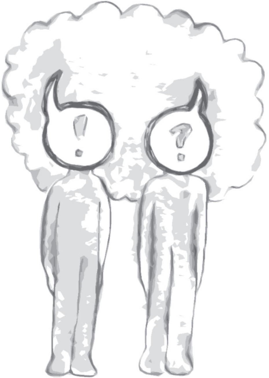
Verwarring - Monique Luiken