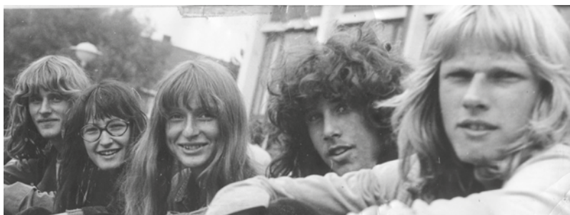
Spinoza Lyceum, 1970