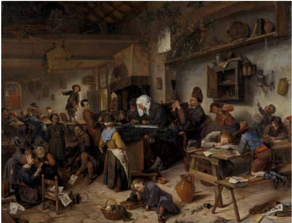
Figuur 1.1 Individueel onderwijs. De dorpschool, Jan Steen, 1662 Bron: Scottish National Gallery.

Alle kinderen konden het bordwerk nu zien en het overnemen op hun eigen leitjes. Het was een grote stap van individueel onderwijs naar klassikaal onderwijs. De leerkracht kon zijn aandacht nu schenken aan de hele klas tegelijk in plaats van aan één leerling.