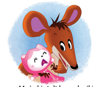
Muis kietelt haar buikje.