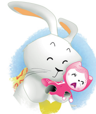
Konijn knuffelt haar.