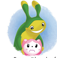
Rups aait haar hoofdje.