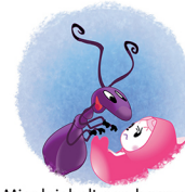
Mier kriebelt aan haar voetje.