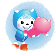
Lux lacht naar haar.