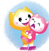
LouLou tilt Lana uit bed.