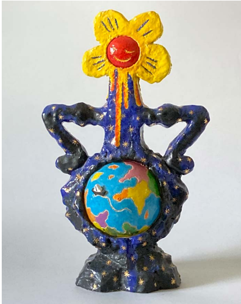
Moeder Aarde, keramiek 1994, © M. van Os