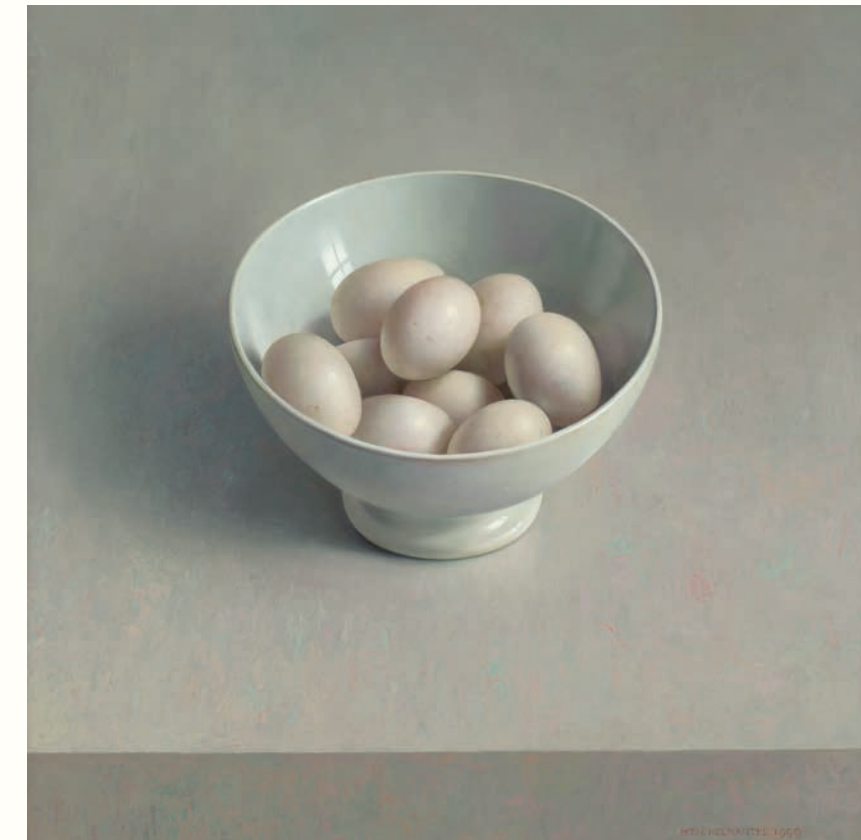
Witte porseleinen kom met eieren • 58 x 59 cm • 1999 Romeins glas en eierschalen • 20 x 66,5 cm • 1998