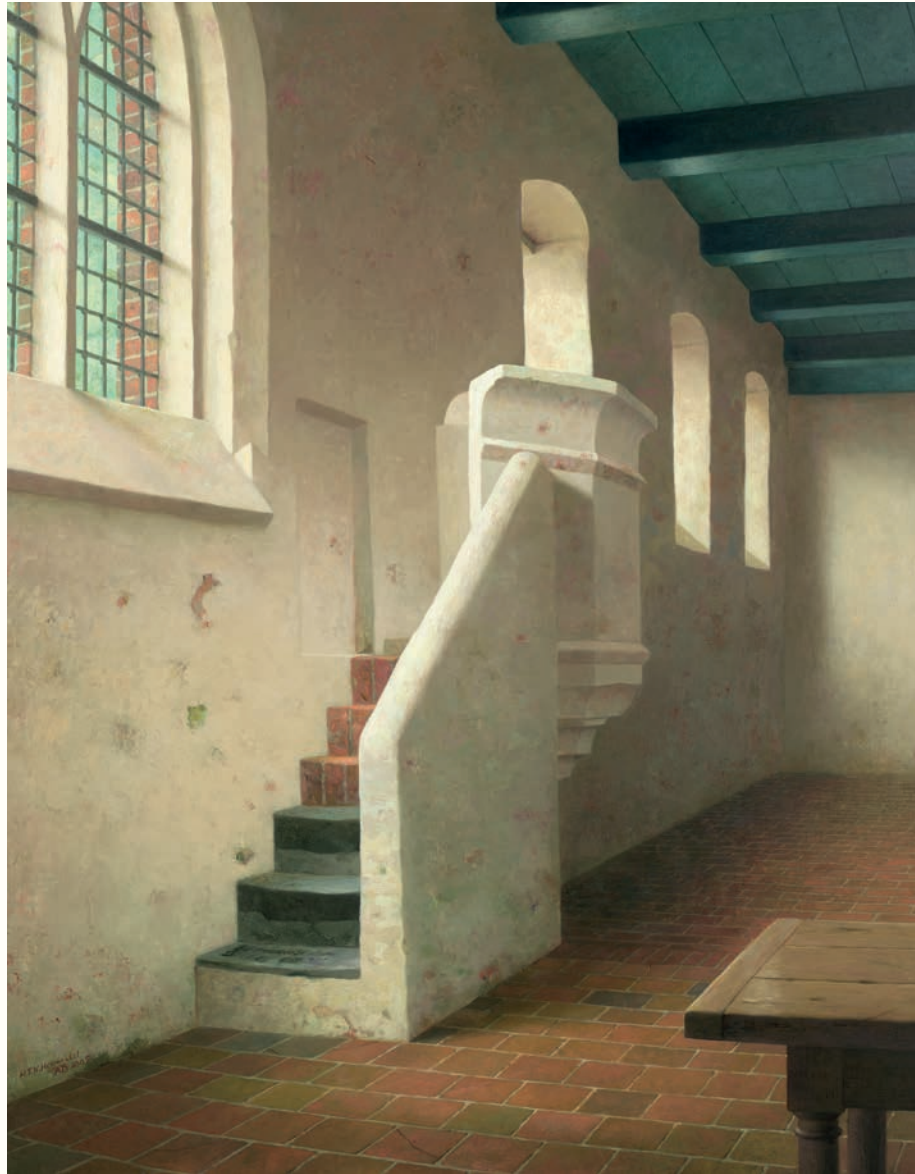
De 13e-eeuwse stenen preekstoel in de kerk van Fransum • 81,5 x 64 cm • 2005