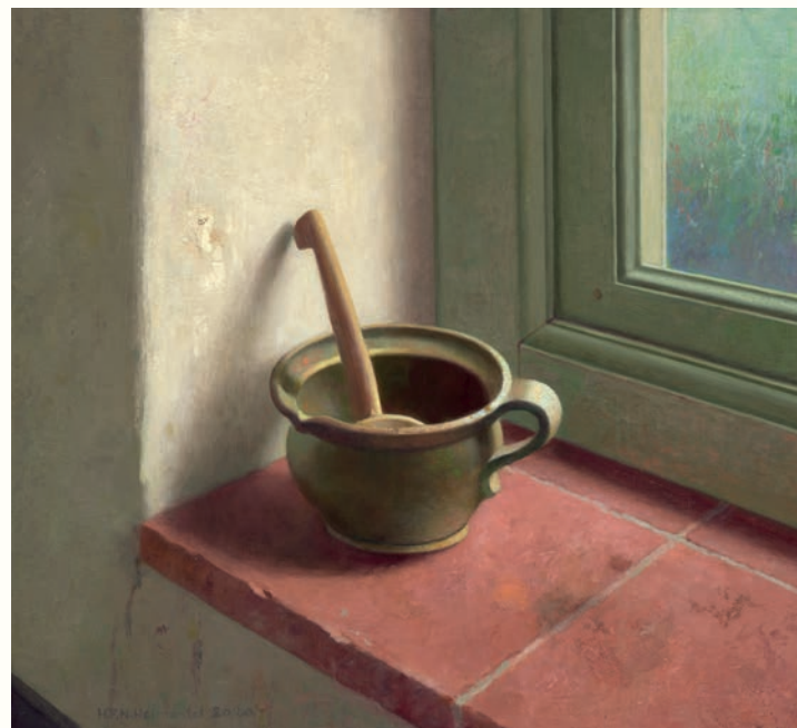
Compositie met kookpot • 40 x 45 cm • 2020