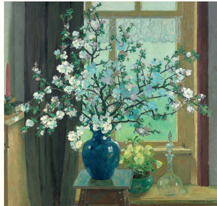
Appelbloesem 122 x 129 cm • 1967 In het huis bij Bottemaheerd