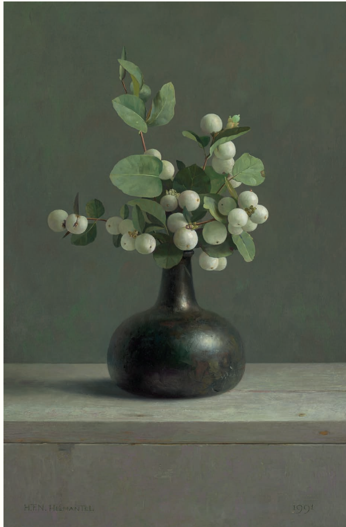
Stilleven met sneeuwbes • 46 x 31 cm • 1991