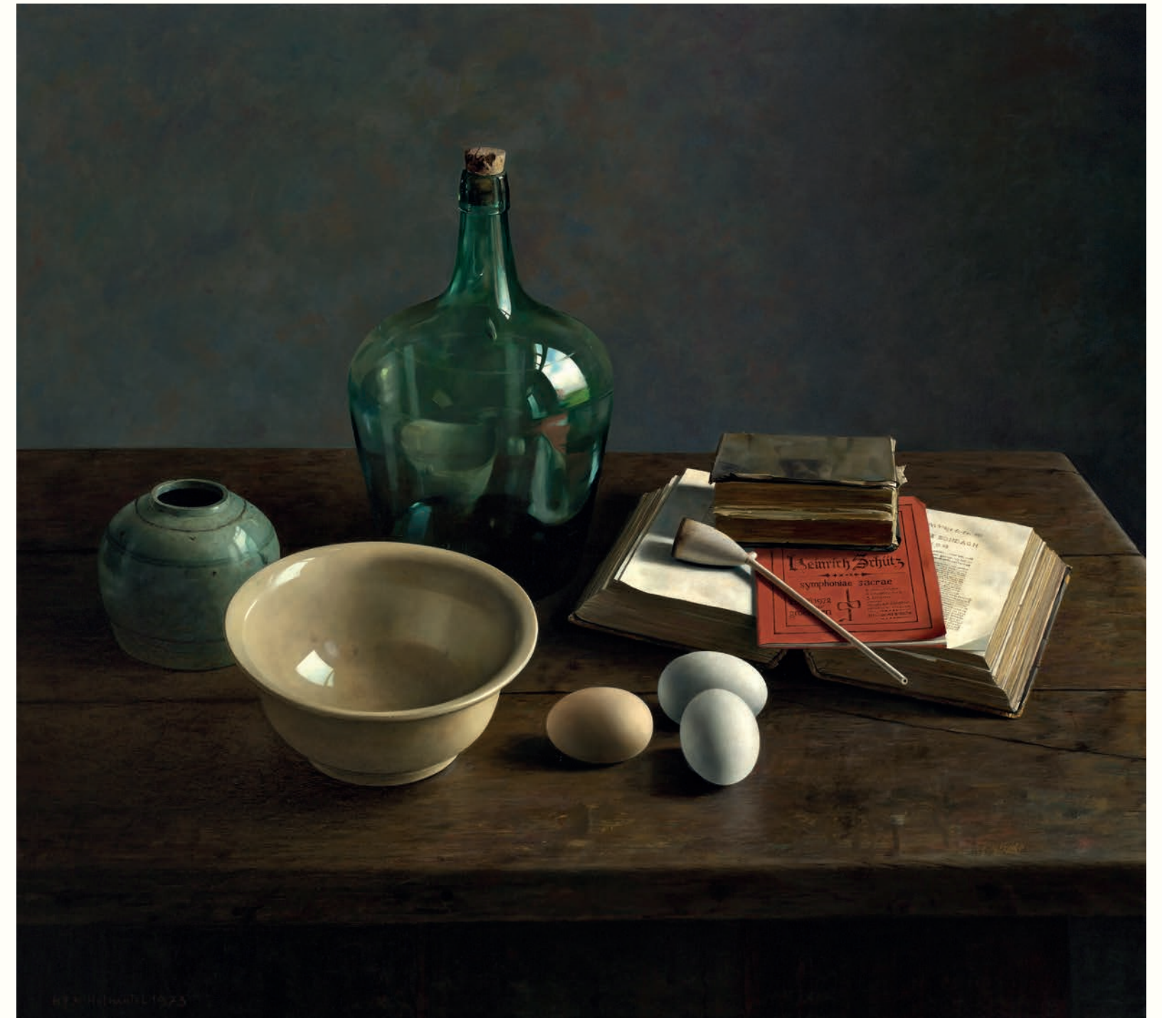
Hommage aan Heinrich Schütz • 105 x 115 cm • 1973