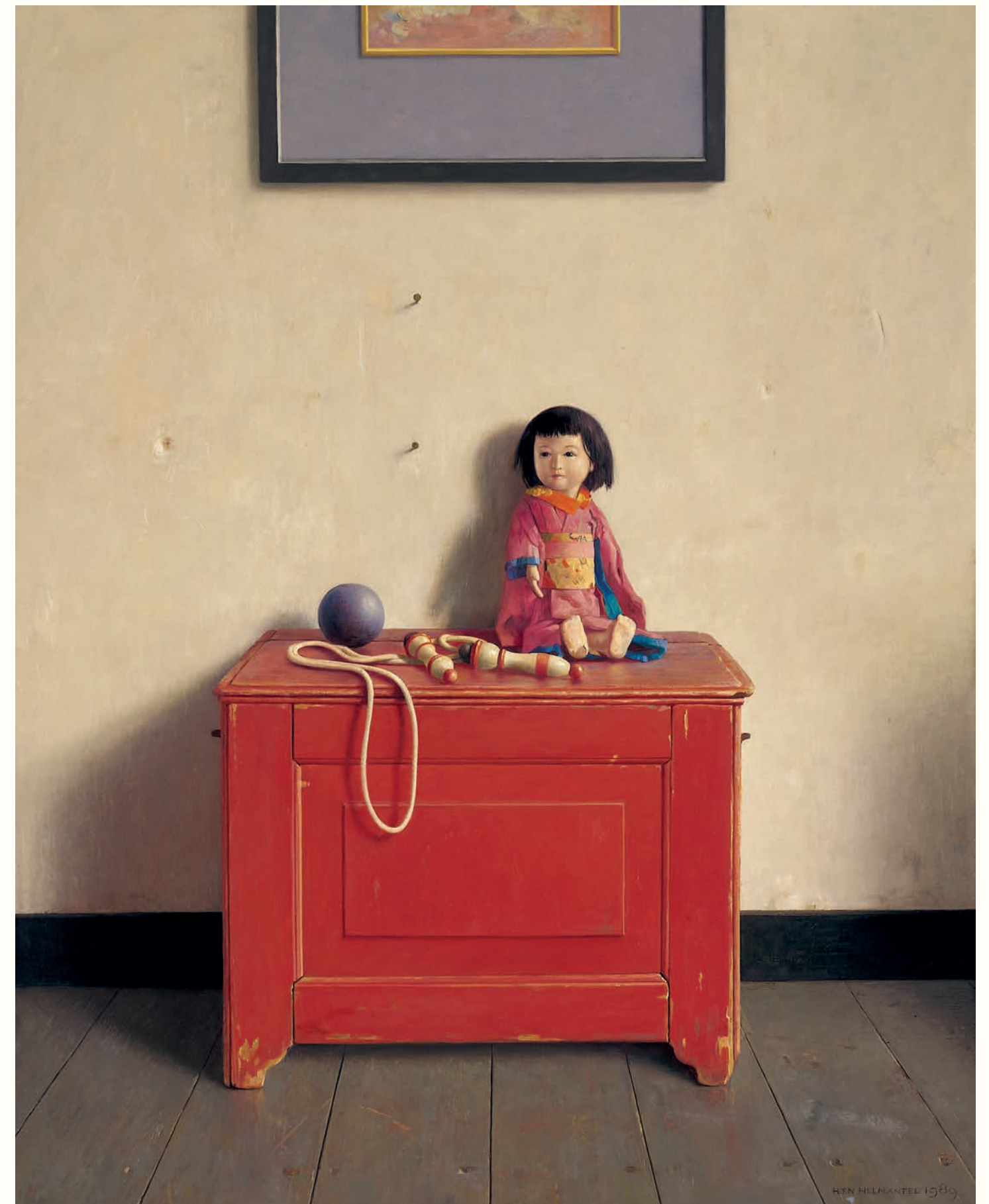
Stilleven met Japanse pop • 112 x 65 cm • 1989