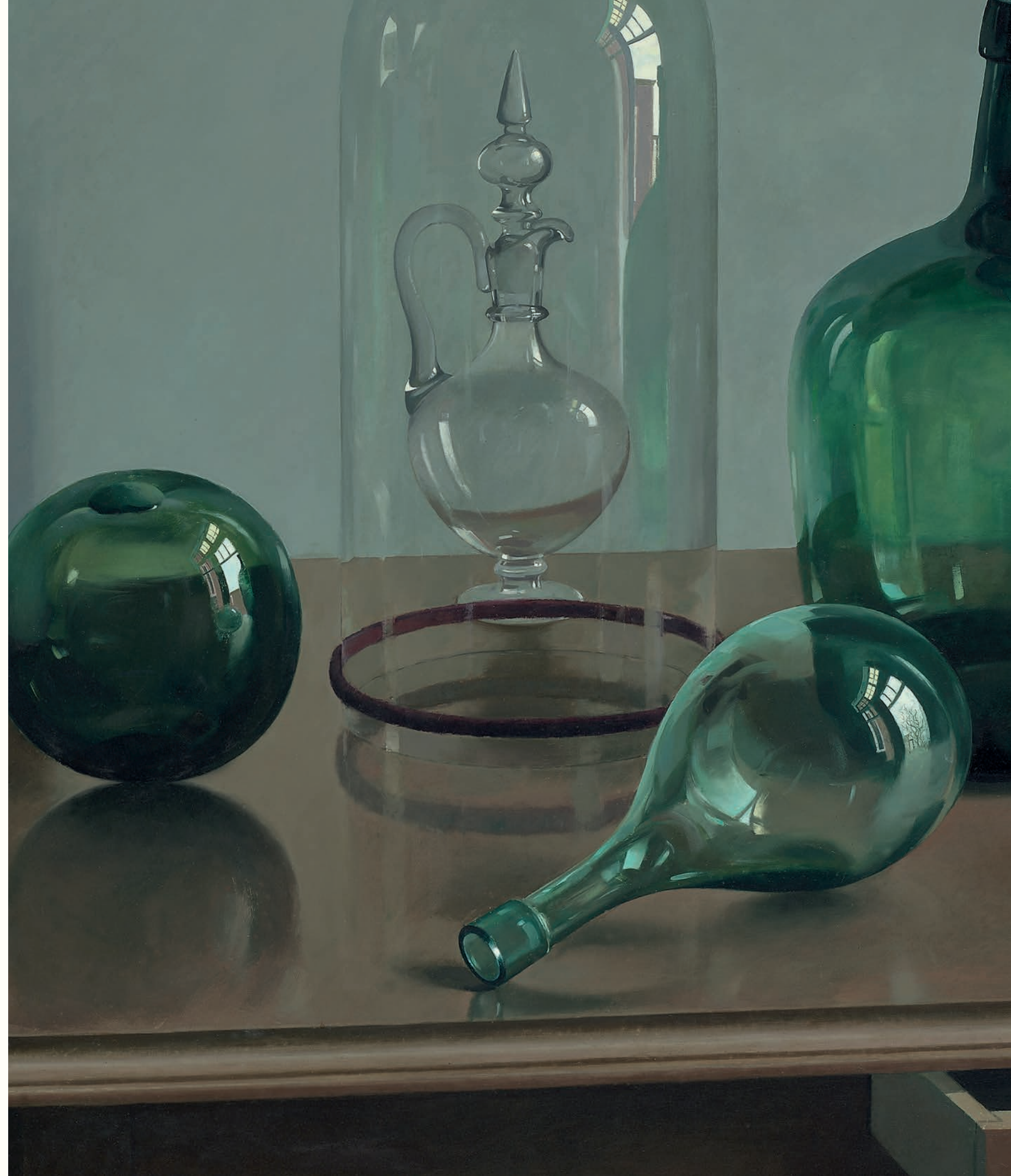
Stilleven met glas • 91 x 95,5 cm • 1968