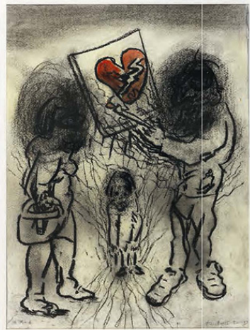
Love , 2018, 40 x 30 cm