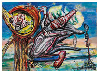
Zelfportret (Self-portrait), 2015, 20,5 x 29 cm