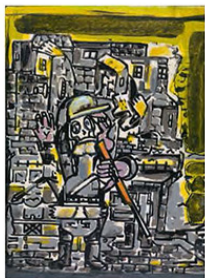
De stad (The city), 2016, 29 x 20,5 cm