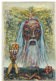
Zelfportret (Self-portrait), 2017, 69 x 44 cm