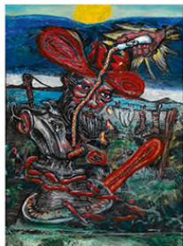
De gelijmde Rubens (The glued Rubens), 2016, 29 x 20,5 cm