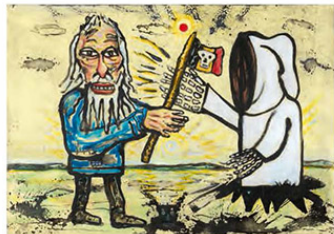
Ik III, 2017, 70 x 100 cm