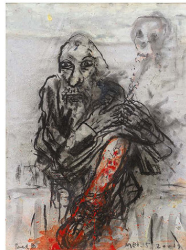
Sorazius, 2019, 42 x 30 cm