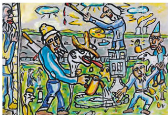
Zelfportret met konijn (Self-portrait with rabbit), 2016, 20,5 x 29 cm