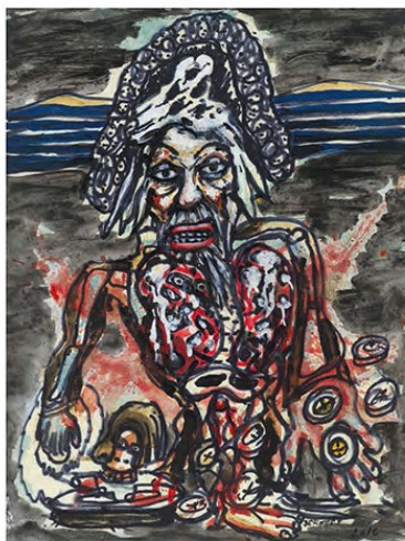
De geldsmijter (The spendthrift), 2016, 99,5 x 29,5 cm