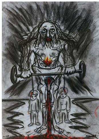
Papa (Daddy), 2018, 40 x 30 cm