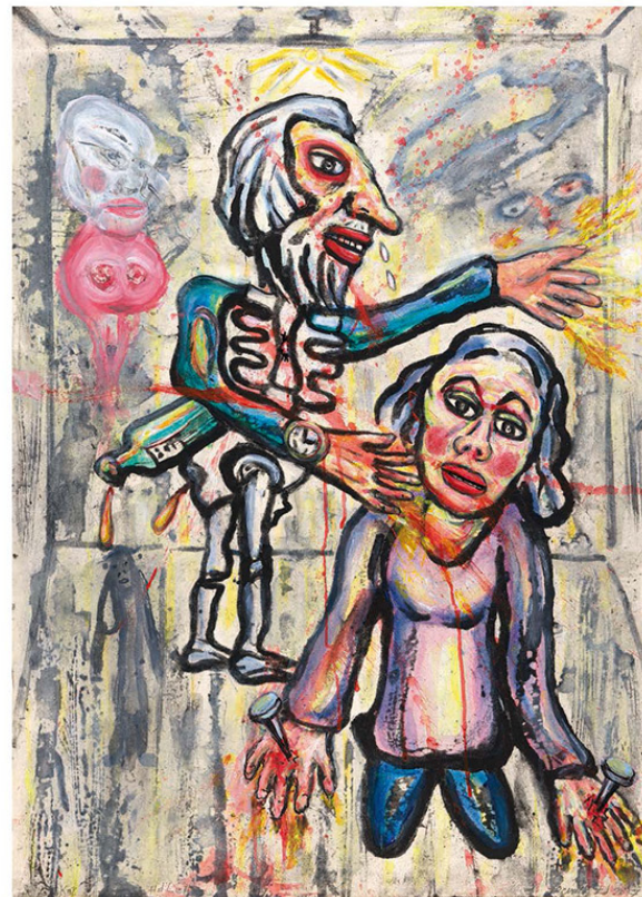
Kijk naar het licht (Look to the light), 2017, 100 x 70 cm