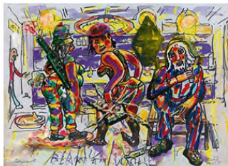
Black and white, 2016, 20,5 x 29 cm