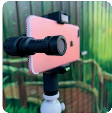
Een voorbeeld van een shotgun microfoon

Een andere optie is een handmicrofoon, die wordt ook veel gebruikt bij nieuws- en actualiteitenprogramma's. Het is een grote microfoon en je kunt er eventueel een plopkap bij bestellen met het logo van je organisatie. Het geluid is over het algemeen zeer goed en professioneel. Bijkomend voordeel is dat je als interviewer wat meer controle hebt over de lengte van een antwoord. Je kunt iemand onderbreken door de microfoon naar je toe te halen en een nieuwe vraag of een vervolgvraag te stellen. Als je zo'n microfoon gebruikt, dan moet je telefoon bijna wel op een statief staan. Je smartphone vasthouden en tegelijk de microfoon heen en weer bewegen levert gegarandeerd een heel rommelig beeld op.