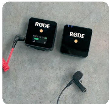
De zender (r) en ontvanger (l) van de Røde Wireless Go