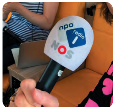
Een voorbeeld van een plopkap