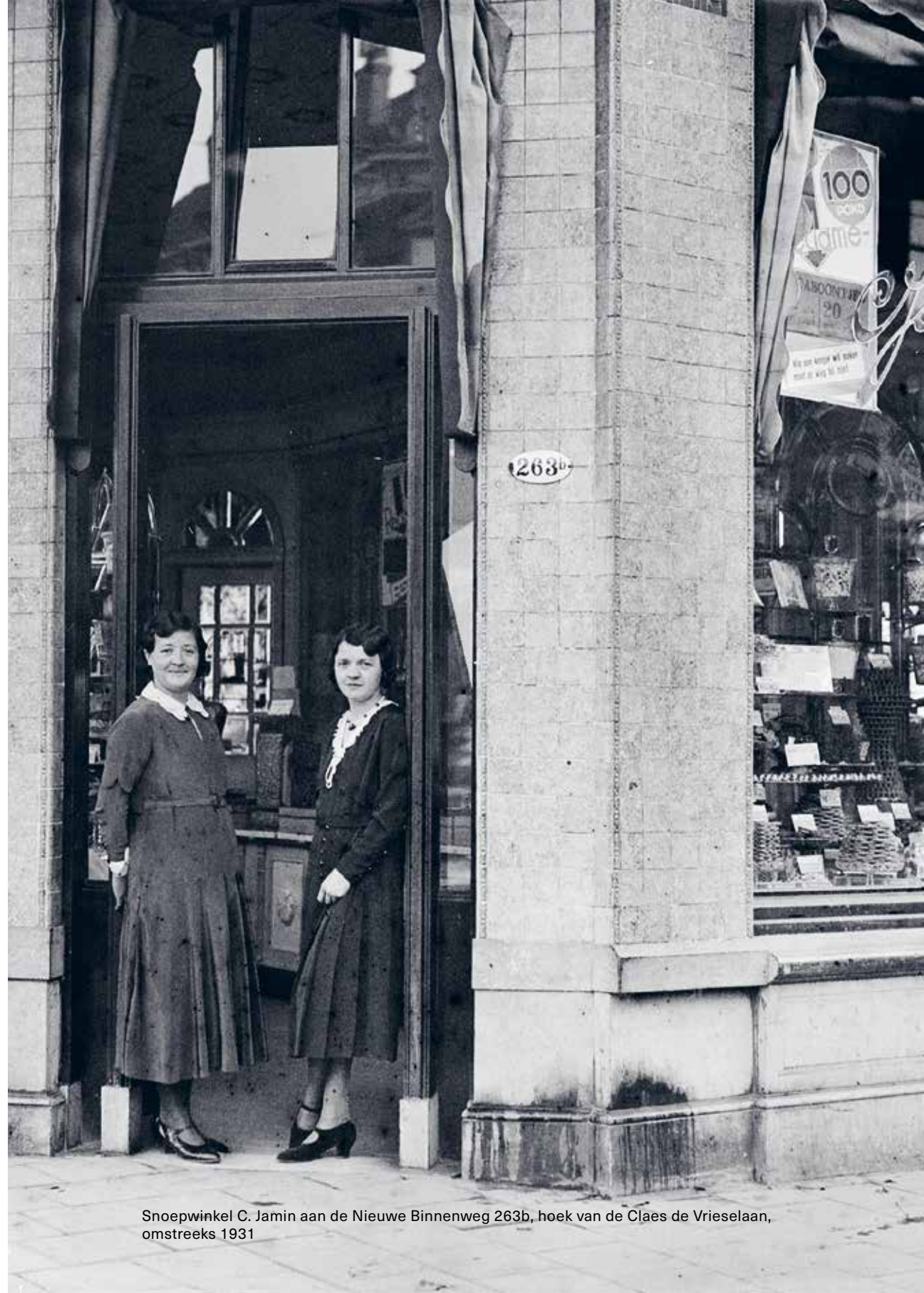
Snoepwinkel C. Jamin aan de Nieuwe Binnenweg 263b, hoek van de Claes de Vrieselaan, omstreeks 1931

Rotterdam is een stad met vele gezichten: ruim 623.000 inmiddels, als we flauw gaan doen. Van die 623.000 Rotterdammers werken er 307.000. Daarvan heeft ruim 9 procent een baan in de detailhandel. Meer dan 15 procent van de in Rotterdam gevestigde bedrijven staat in de categorie retail in de Kamer van Koophandel ingeschreven. Dat is veel. Rotterdam omvat 69 winkelgebieden, meer dan andere steden in de Randstad. De gemeente omschrijft het belang daarvan in haar Detailhandelsnota 2017 zo: ‘Detailhandel en winkelgebieden spelen een vitale rol in de aantrekkelijkheid van de stad, als sector waar veel mensen werken en waar sociale cohesie wordt versterkt.’ Anders gezegd: ondernemers zijn de lijm van de stad. Ze zorgen niet alleen voor ons dagelijks brood, maar ook voor ons dagelijks buurtgevoel.