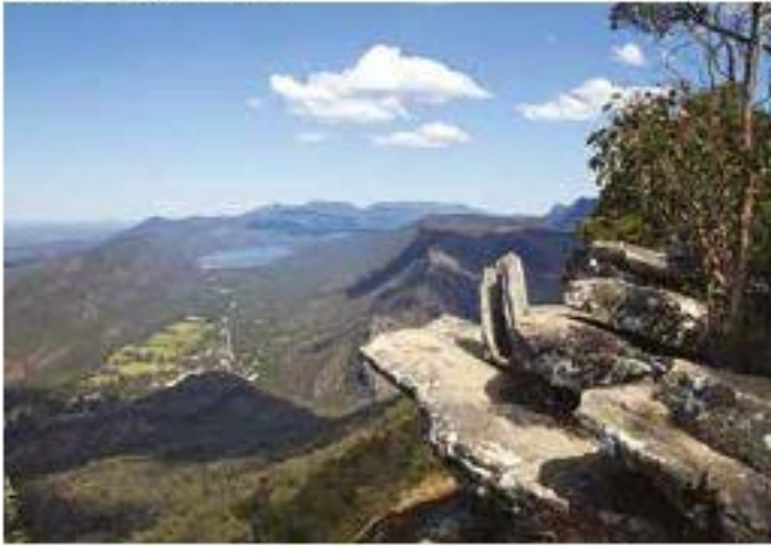
Boroka Lookout Silentsheet, The Pinnacles