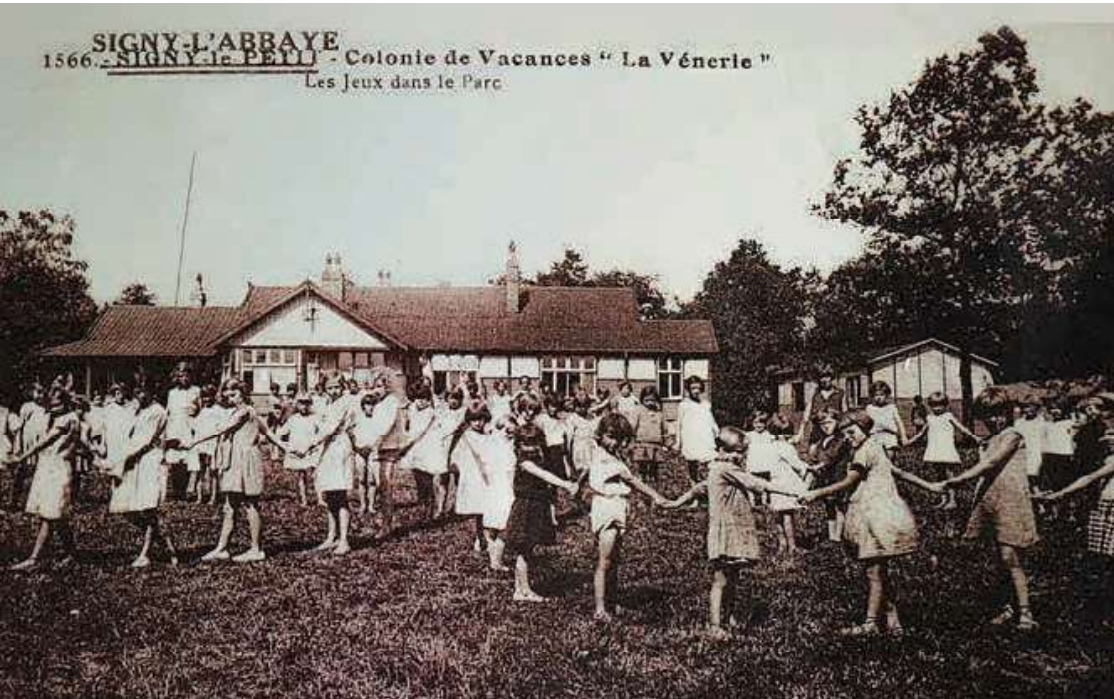
SIGNY-L'ABBAYE 1566 - SIGNY LE PETIT - Colonie de Vacances "La Vénérie" Les Jeux dans le Parc