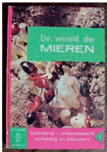
Mijn eerste boekje over leven en werk van de mieren.

om de zwarte wegmieren te volgen. Door al dat kruipen over de ruwe stenen vormde zich op mijn knie  n een dikke eeltlaag. Mijn moeder ergerde zich soms aan wat ze plagend mijn olifantenknie  n noemde. Toen ik zes of zeven jaar oud was, kreeg ik een boekje over het leven en