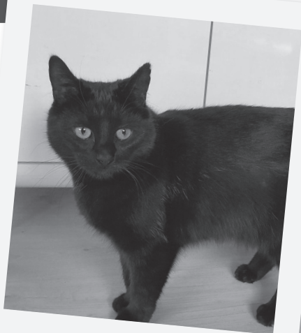
Een dapper beestje

Het leukste aan 's ochtends sporten is de heerlijke douche