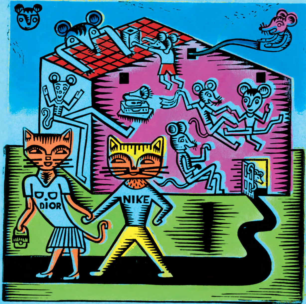
ALS DE KAT VAN HUIS IS, VIEREN DE MUIZEN FEEST