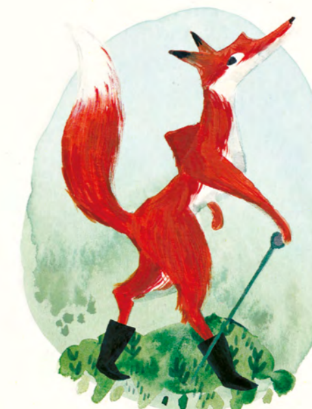
een hoffelijke vos