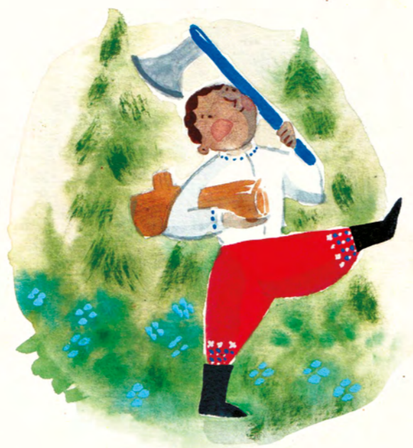
een vrolijke houthakkerszoon