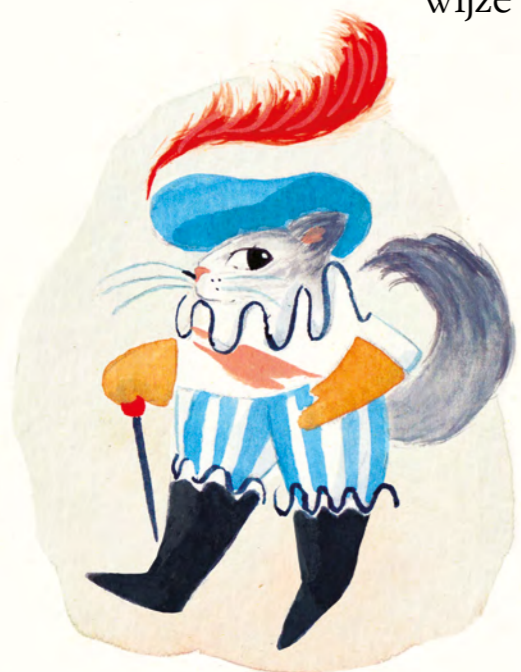
een kat in prachtige kleren