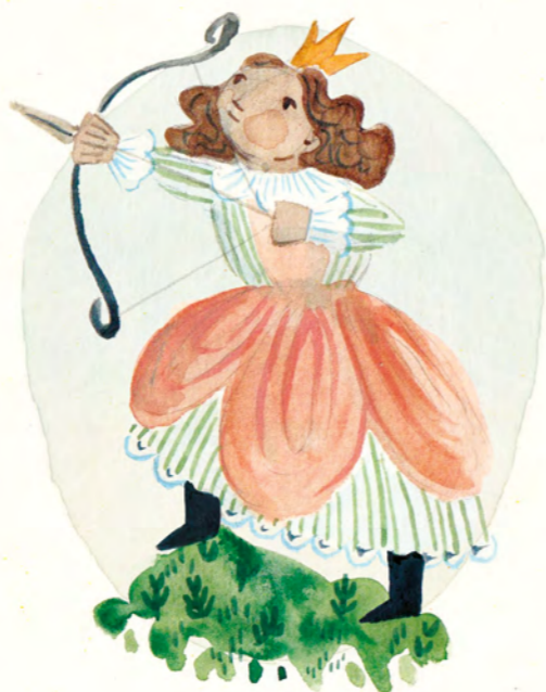
een slimme prinses