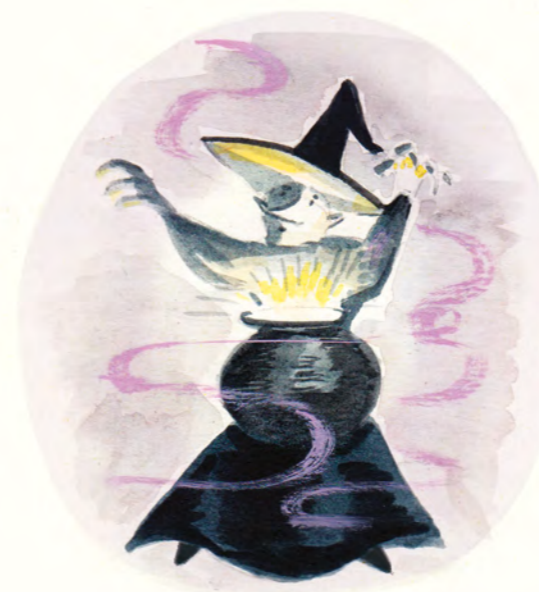
een machtige heks