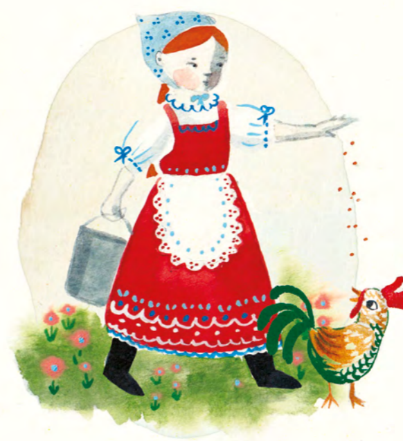
een aardige boerenmeid