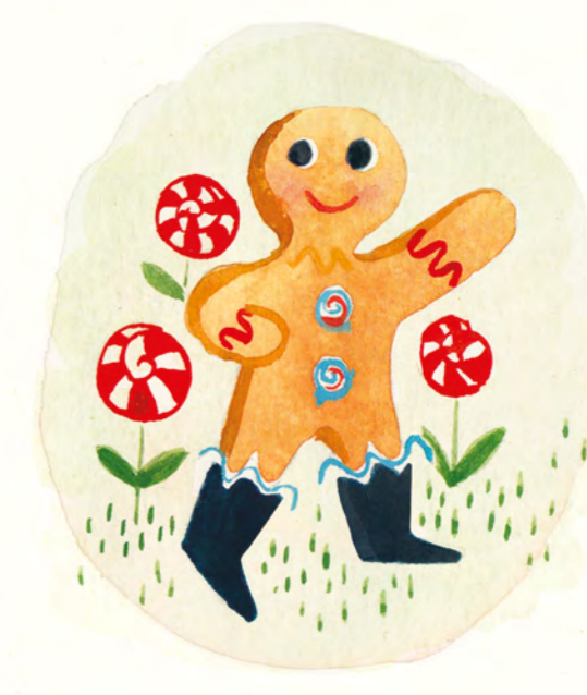
een vriendelijke koekeman