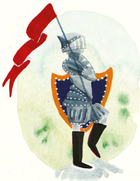
een nobele ridder