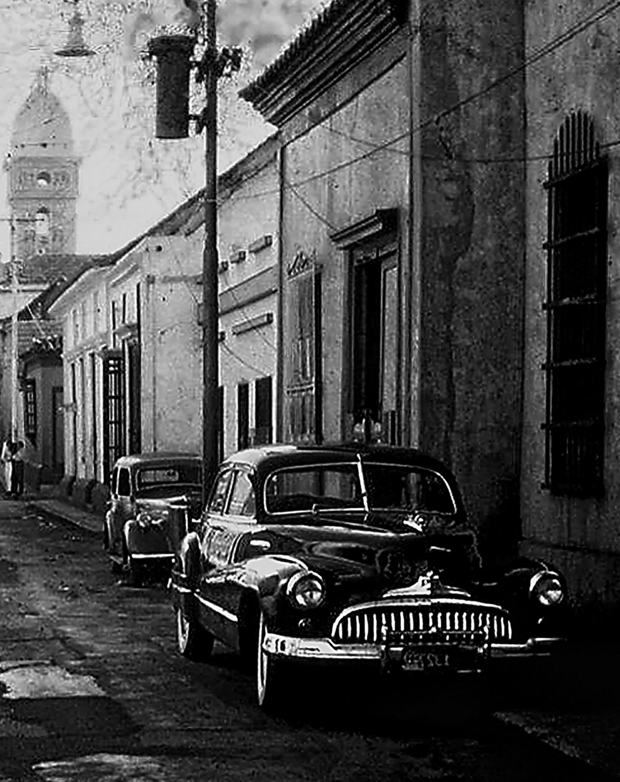
Maracaibo, Venezuela, circa 1950.