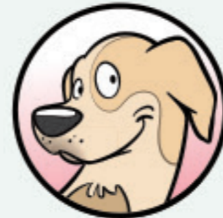
DE AARZELENDE AFWACHTER