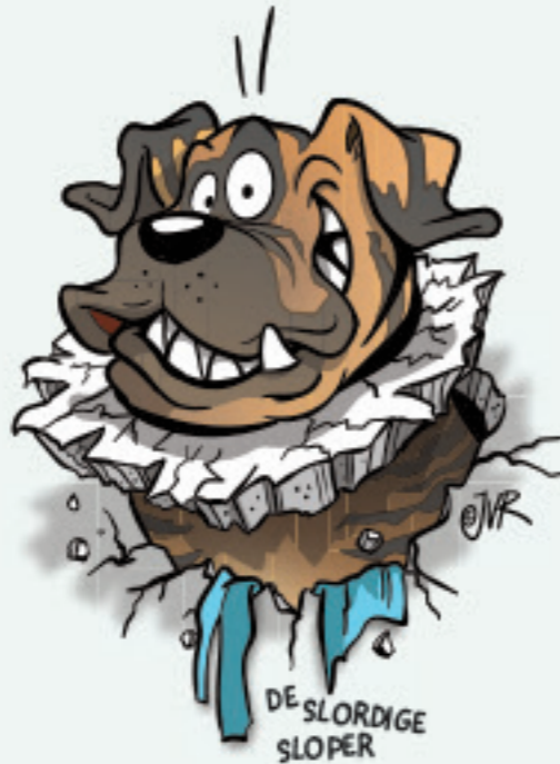
DE SLORDIGE SLOPER