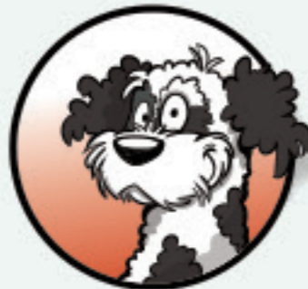
DE EIGENWIJZE EIGENHEIMER