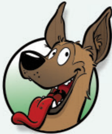
DE SNELLE SAMENWERKER