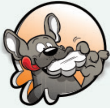
DE GULZIGE GABBER