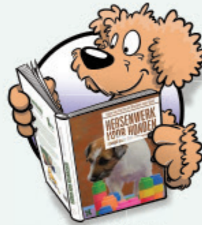
DE DOORDACHTE DENKER