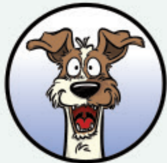
DE STUIITERENDE SNUFFELAAR