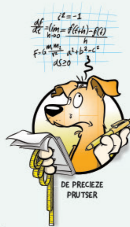
DE PRECIEZE PRUTSER