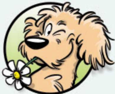
DE BLIJE BRAVERD