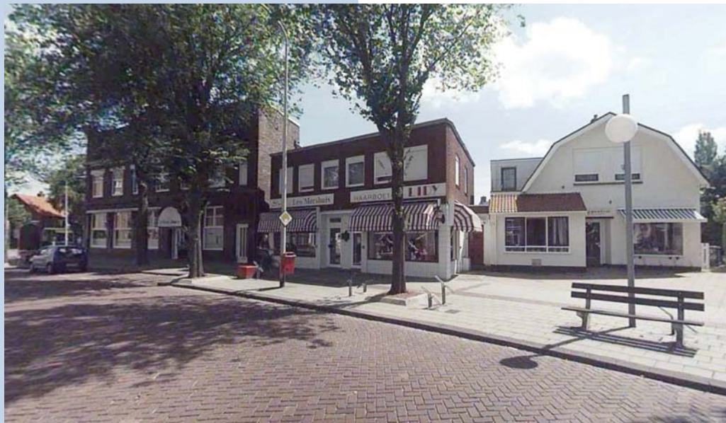
Huis/winkel Industriestraat 43 rond 2000, Foto: Ton Schaap