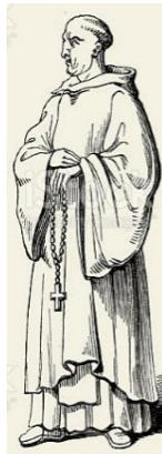
Een benedictijner monnik

Het teruggetrokken leven van monniken en kluizenaars heeft mij altijd al geïntregeerd. In mijn jeugd bewaakten monniken mij in de rooms-katholieke speeltuin in Rotterdam. Ik zie nog het donkerbruine kruis dat zij aan een lange houten ketting om hun middel droegen.