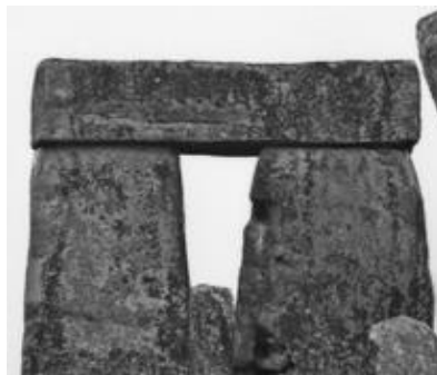
Stonehenge Amesbury (Eng)

De priesteressen die deze kettingen droegen, spraken de zegen uit over mensen, maar konden ook vervloekingen uitspreken. Zij deden voorspellingen over de veldtochten en de levensloop van mensen. Zij werden begraven onder grote zware stenen die de heiligheid van het graf aangeven. Ook werden er stenen boven het graf opgericht.