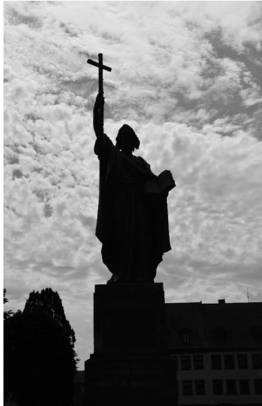
Standbeeld van Bonifatius in Fulda (D) 2019