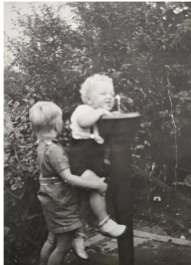
Het kraantje aan de overkant van de Wingerdweg.