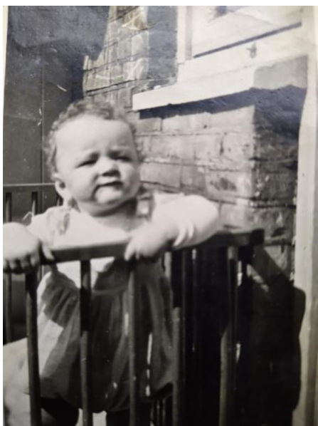
De veranda was het eerste jaar mijn speelterrein.

De eerste herinneringen zijn natuurlijk niet van mijzelf. De vroegste verhalen baseer ik op mijn moeder, die veelvuldig en graag over vroeger vertelde. Haar familie en haar kinderen waren zeer belangrijk. Ik was de laatste uit een reeks van vijf kinderen, of eigenlijk zes omdat mijn oudste broer er een van een tweeling was. Mijn oudste zusje is echter al na twee dagen overleden. Zij woog slechts 3 pond en dat was in 1936 te weinig om te overleven.