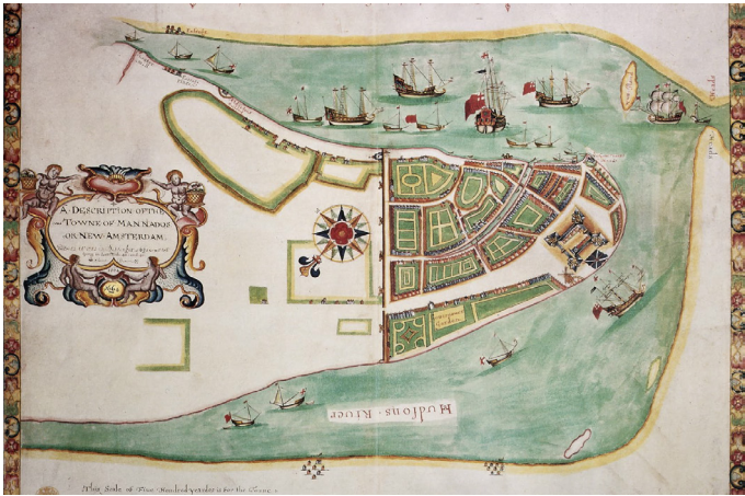
Nieuw-Amsterdam op de zuidpunt van Manhattan omstreeks 1664.

op pad en zelf de historische plekken ervaren. Het is makkelijk om te lezen, ik heb het niet bedoeld als wetenschappelijk betoog. Het is juist bedoeld om de 'gewone' bezoeker van de stad een leuke historische aanvulling op zijn of haar avontuur te geven.