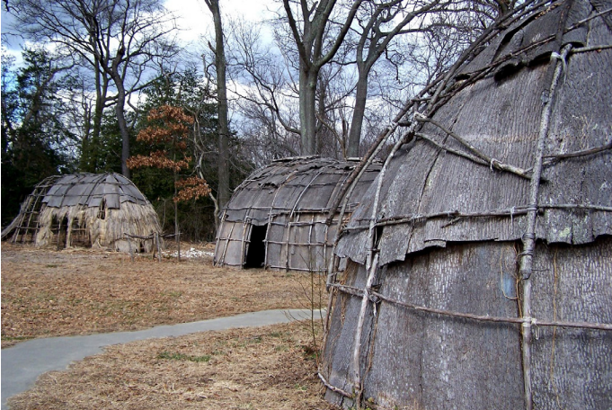
Nagebouwde Lenape wigwam, bedekt met boomschors.

Ieder jaar bezoeken veel Nederlanders New York. En terecht, een bezoekje aan de 'Big Apple' is meer dan de moeite waard. En velen weten dat Nederland ooit New York verkocht aan de Engelsen. Dat de stad ooit Nederlands was, blijkt uit de vele Nederlandse namen die je overal in de stad tegenkomt: Stuyvesant Plaza, New Utrecht Avenue, Bleecker Street, et cetera.