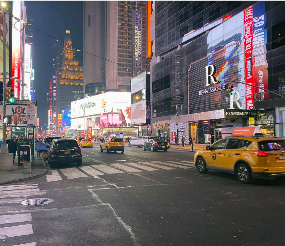
Times Square, midden op Manhattan, het bruisende hart van de stad (RVG).