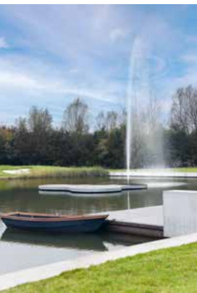
VYNCRE | 36