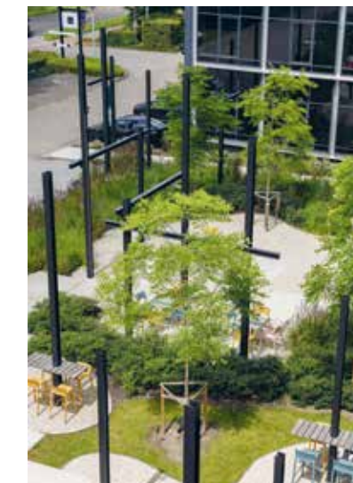
THE GRID | 164