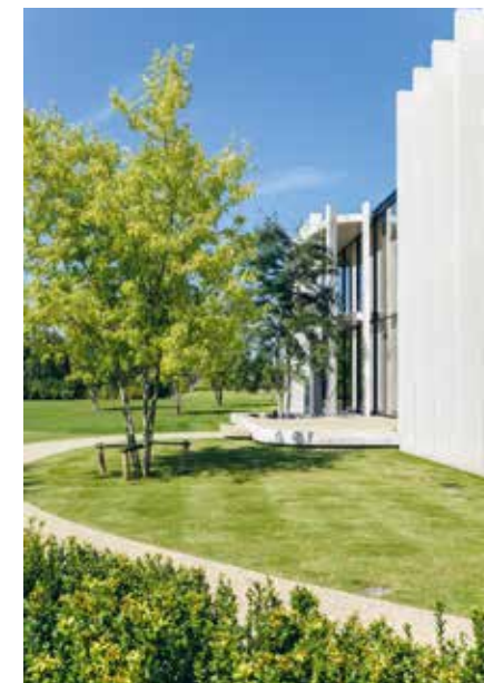
QUATRA | 140