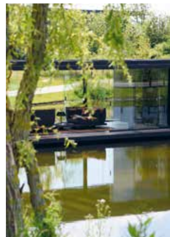
NOA OUTDOOR LIVING RENSON OUTDOOR | 64