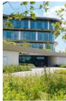
AGRISTO | 8