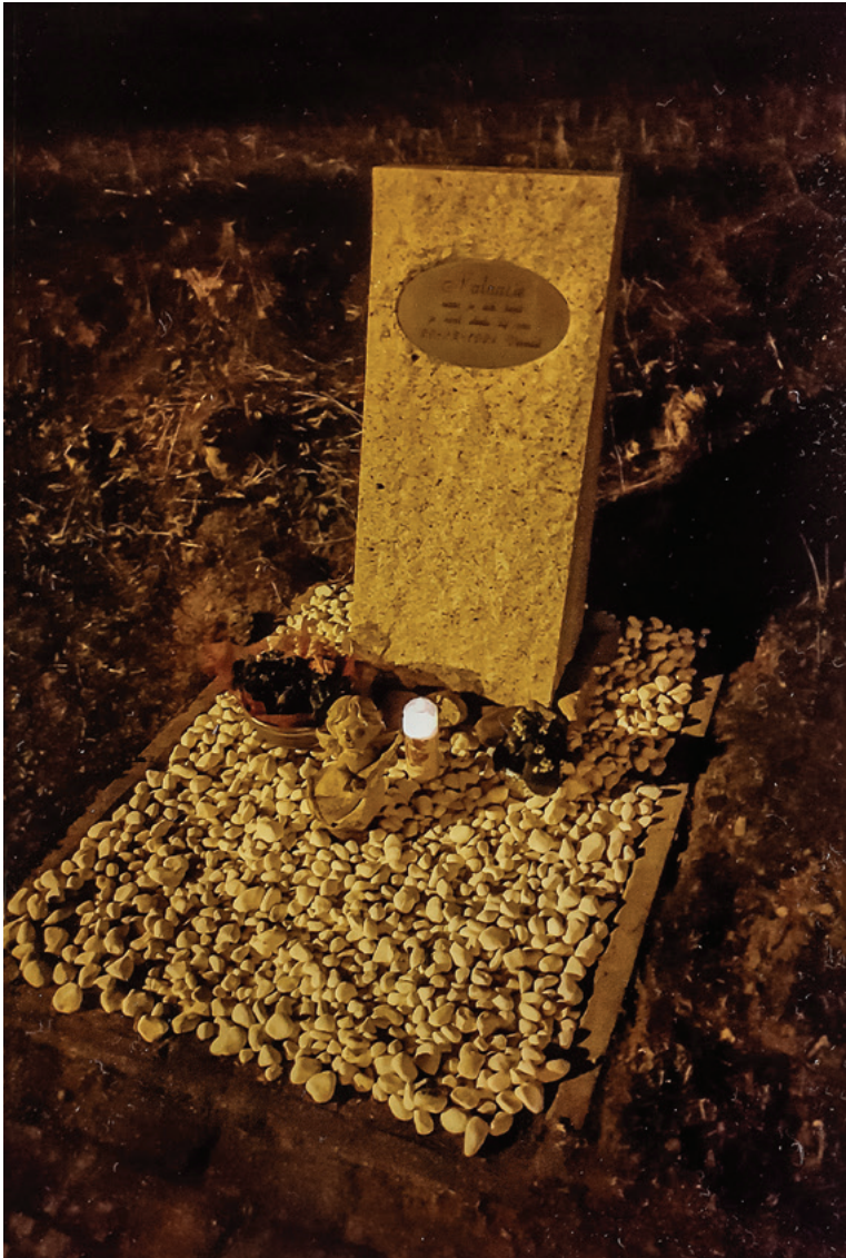
Op de plek waar Nathalie verdween staat al een tijdje een gedenksteen.