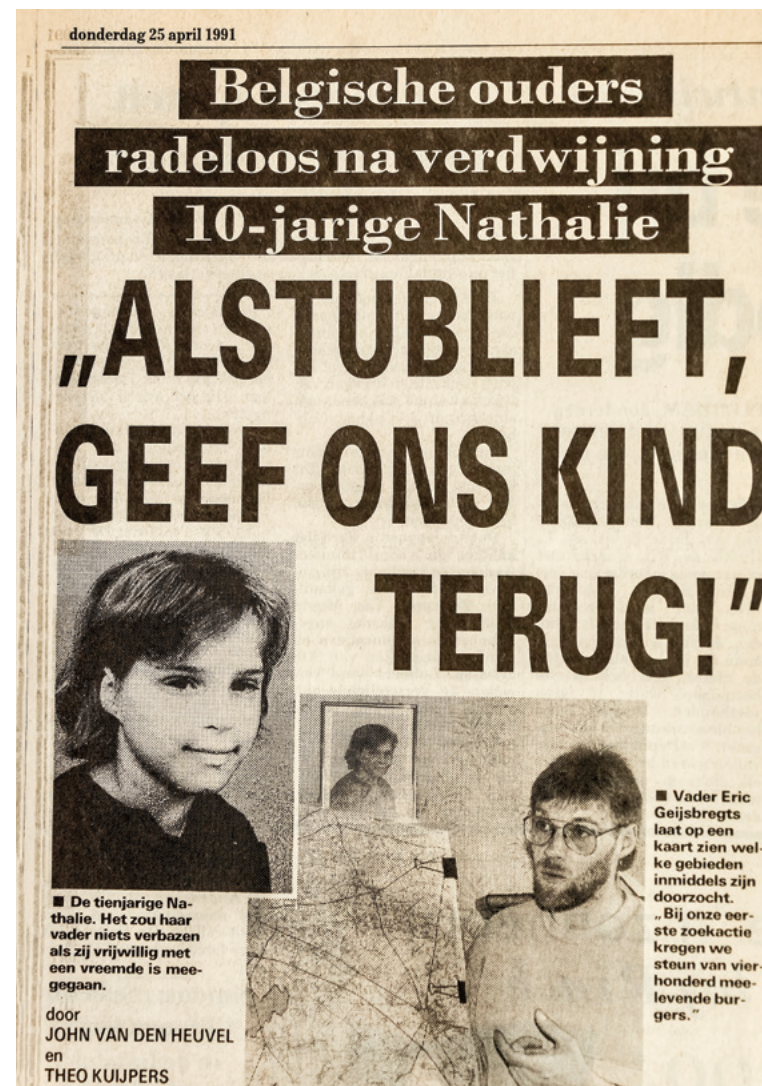
Een interview met de Nederlandse krant De Telegraaf. Tot op de dag van vandaag hou ik rekening met een Nederlandse dader.