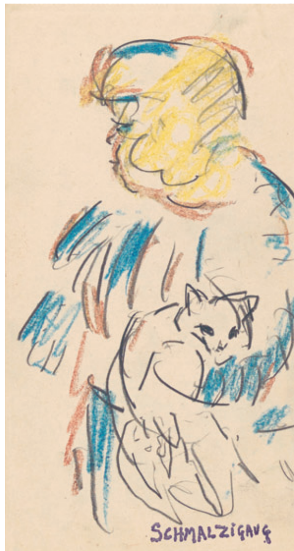
Jules Schmalzigaug Meisje met kat , 1915–1917, kleurkrijt, conté en potlood op papier, 200 × 106 mm, schenking Fonds Lens- Ghesquière, 2018, Koninklijk Museum voor Schone Kunsten Antwerpen – Collectie Vlaamse Gemeenschap, inv. 3936