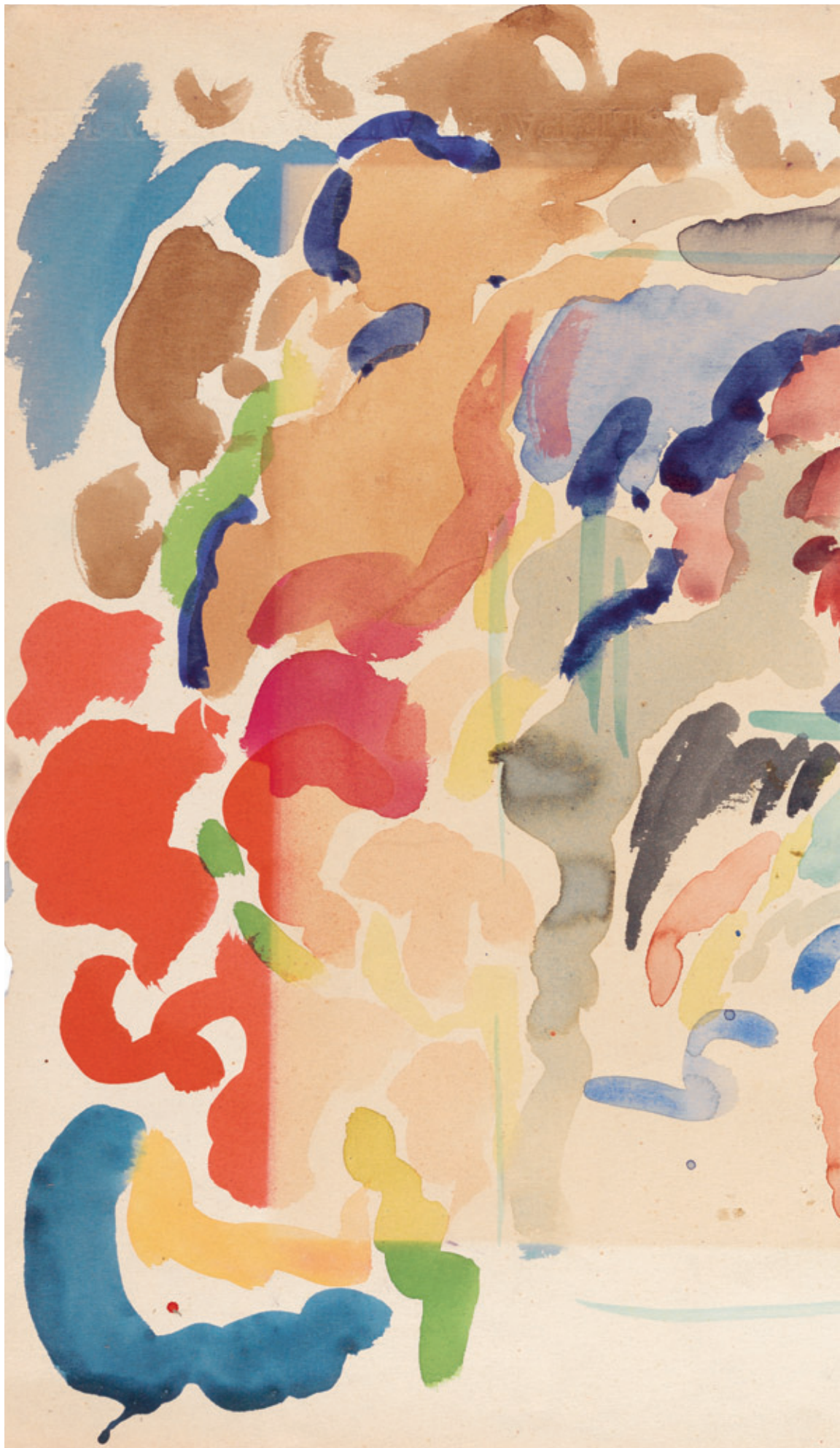
Rik Wouters Kleurenstudie, s.d. , aquarel op papier, 375 × 528 mm, Koninklijk Museum voor Schone Kunsten Antwerpen – Collectie Vlaamse Gemeenschap, inv. 2762