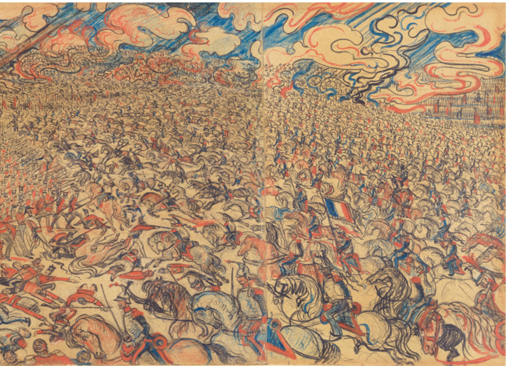
James Ensor De kurassiers in Waterloo , 1891, contépotlood en rood en blauw krijt op papier, 225 x 625 mm, Koninklijk Museum voor Schone Kunsten Antwerpen - Collectie Vlaamse Gemeenschap, inv. 2740