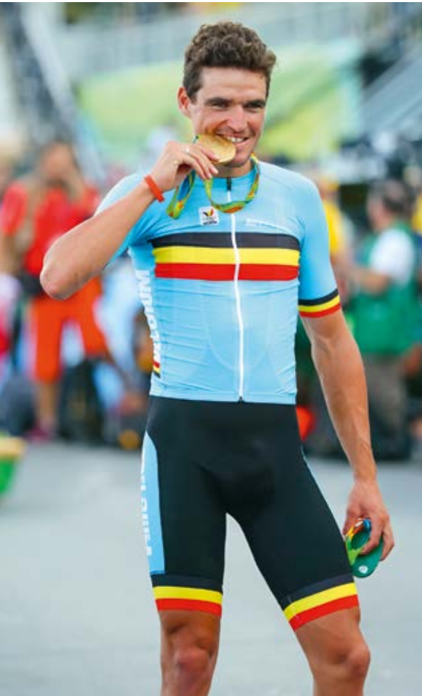
Greg Van Avermaet

De verklaring ervoor mocht ook voor mij logisch zijn: 'Hij was sexy toen hij jong was, maar met 34, 35 jaar bent u dat natuurlijk niet meer.'