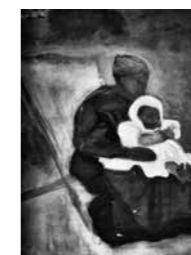
FIG. 28 , p. 22 Femme et enfant , 1915 Aquarel op papier

Tentoongesteld op de Belgian Exhibition of Modern Art in Kingston upon Thames, 15–27 maart 1915, cat. nr. 56 Grand'mère Gesigneerd onderaan links Huidige verz. onbekend (gepubliceerd in Willy Van den Bussche 1986, p. 23 Couturière )