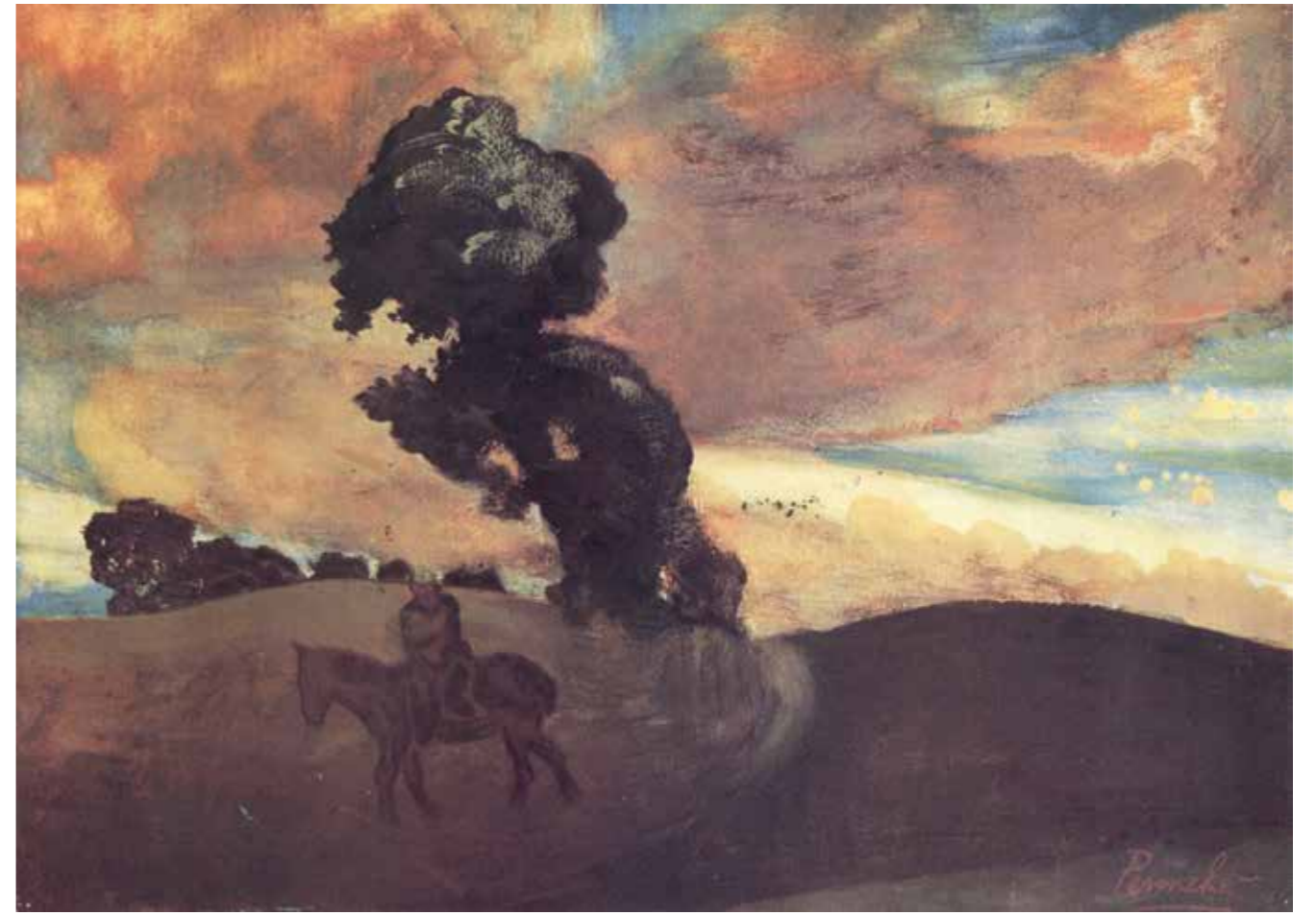
FIG. 37 Constant Permeke, Landschap met ruiter , 1916–1917, huidige verz. onbekend