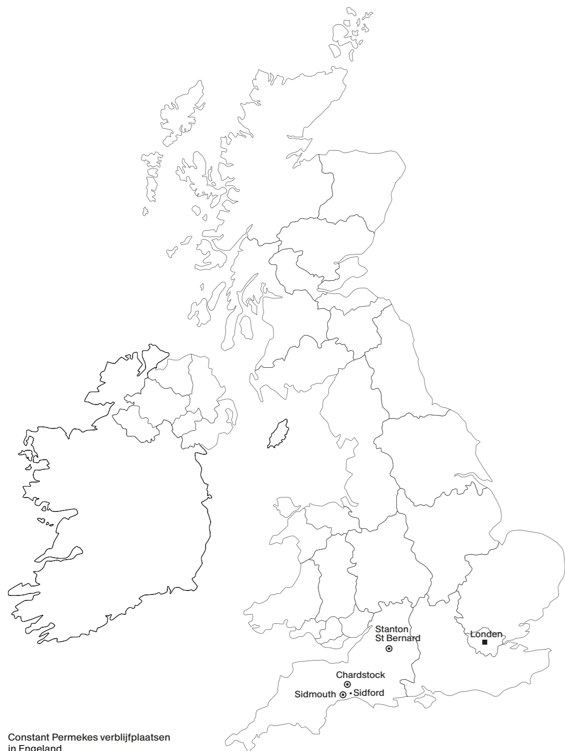
Constant Permekes verblijfplaatsen in England

Constant Permeke gaf zijn kunstwerken meestal geen titel, waardoor eigenaars, veilinghuizen, galeries en auteurs er later zelf een titel aan gaven. Het feit dat deze kunstwerken op die manier vaak verschillende titels kregen, maakt het niet eenvoudig om ze te identificeren. Het hiernavolgende overzicht van Permekes werk uit zijn Engelse periode werd opgesteld op basis van museumcollecties, private verzamelingen, boekpublicaties, tentoonstellings- en veilingcatalogi. Voor elk werk werd telkens de oorspronkelijke titel weerhouden of, indien die niet bekend is, de oudst gekende vermelding.