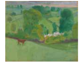
FIG. 38, p. 39

Gesigneerd onderaan rechts Huidige verz. onbekend (voormalige verzameling Arthur Cornette, Antwerpen – gepubliceerd in Avermaete 1970 p. 12)