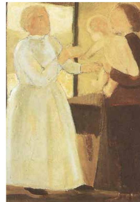
FIG. 33 Constant Permeke, De drie generaties , 1915, huidige verz. onbekend