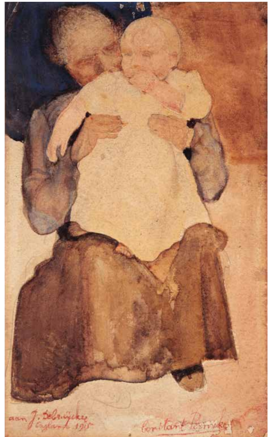
CAT. 2 Constant Permeke, Moeder en kind , 1915, aquarel en inkt op papier, 22 × 13 cm, private verzameling