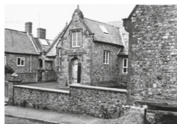
FIG. 31 Saint Andrew's school in Chardstock, met het atelier van Constant Permeke onder het dak, 1916