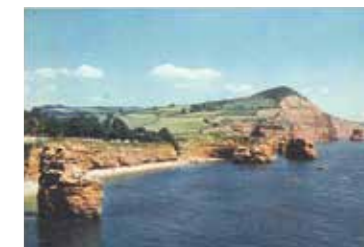
FIG. 35 Sidmouth, graafschap Devon