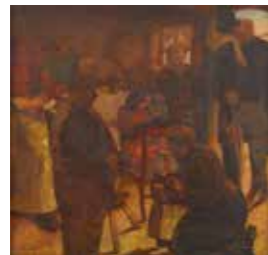
FIG. 49, p. 84

Gesigneerd onderaan rechts Betreft mogelijk het werk tentoon- gesteld op de Exhibition of Belgian art, painting and sculpture, for the benefit of the Croydon General Hospital in Croydon, 21 oktober – 11 november 1916, cat. nr. 72 Invalid Museum de Fundatie, Zwolle en Heino/Wijhe, inv. 0-2193