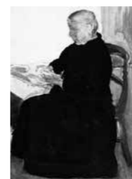
FIG. 27 , p. 22 Grand'mère , 1915 Aquarel op papier

Tentoongesteld op de Belgian Exhibition of Modern Art in Kingston upon Thames, 15–27 maart 1915, cat. nr. 56 Grand'mère Gesigneerd onderaan links Huidige verz. onbekend (gepubliceerd in Willy Van den Bussche 1986, p. 23 Couturière )