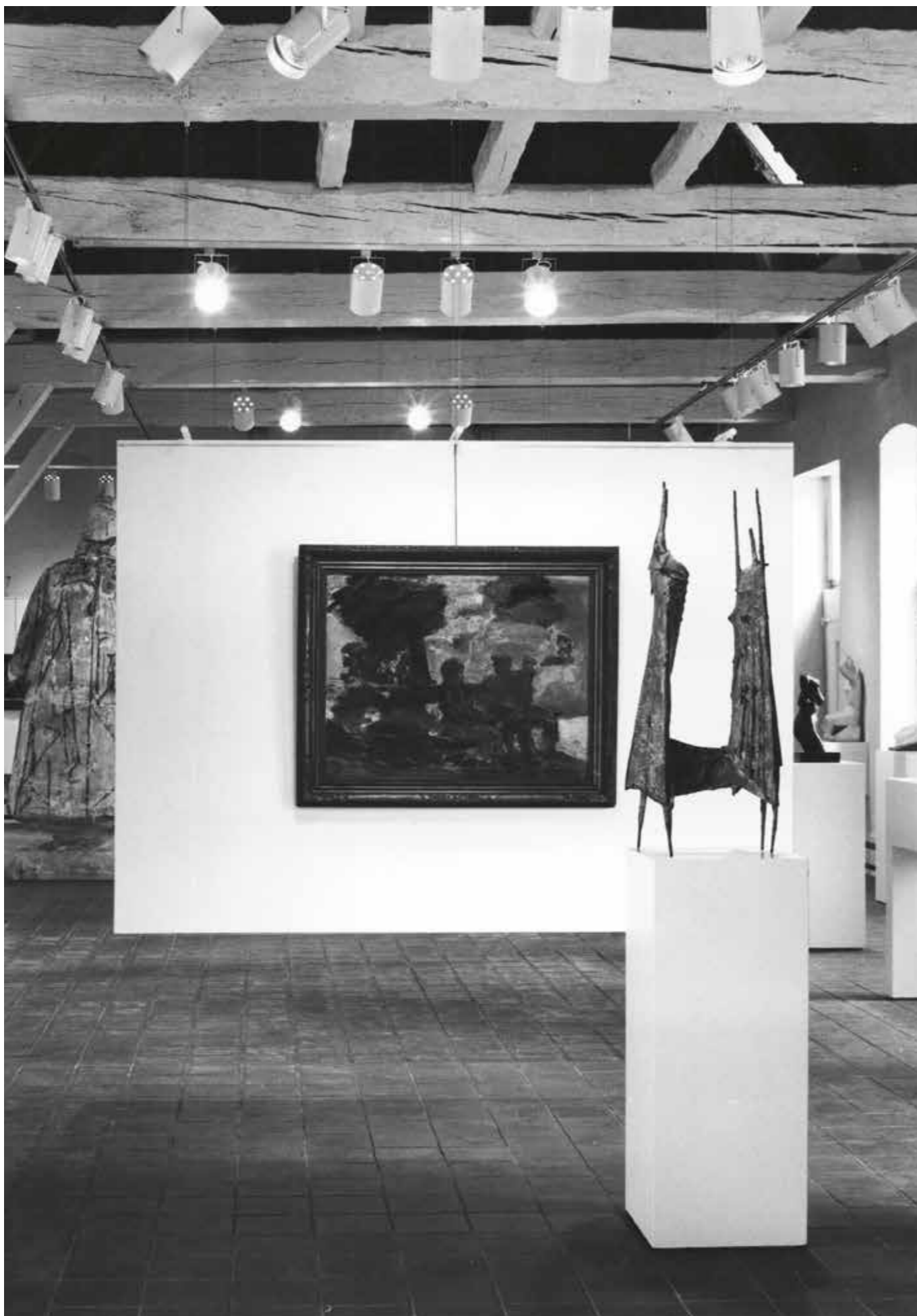
FIG. 52 Constant Permeke, Les Histoires vraies , met op de voorgrond Dance IV (1955) van Lynn Chadwick, in Bouwhuis, bijgebouw van kasteel Het Nijenhuis, geopend als tentoonstellingsruimte op 23 juni 1969. Archief inv. Nr. 16, Museum de Fundatie, Zwolle en Heino/Wijhe