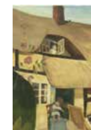
FIG. 29 , p. 23 Gedenkenis van mijn huizeke , 1915

Tentoongesteld op de Belgian Exhibition of Modern Art in Kingston upon Thames, 15–27 maart 1915, cat. nr. 55 Femme et enfant Gesigneerd onderaan links Huidige verz. onbekend (gepubliceerd in Van den Bussche 1986, p. 23 Grand-mère et enfant )