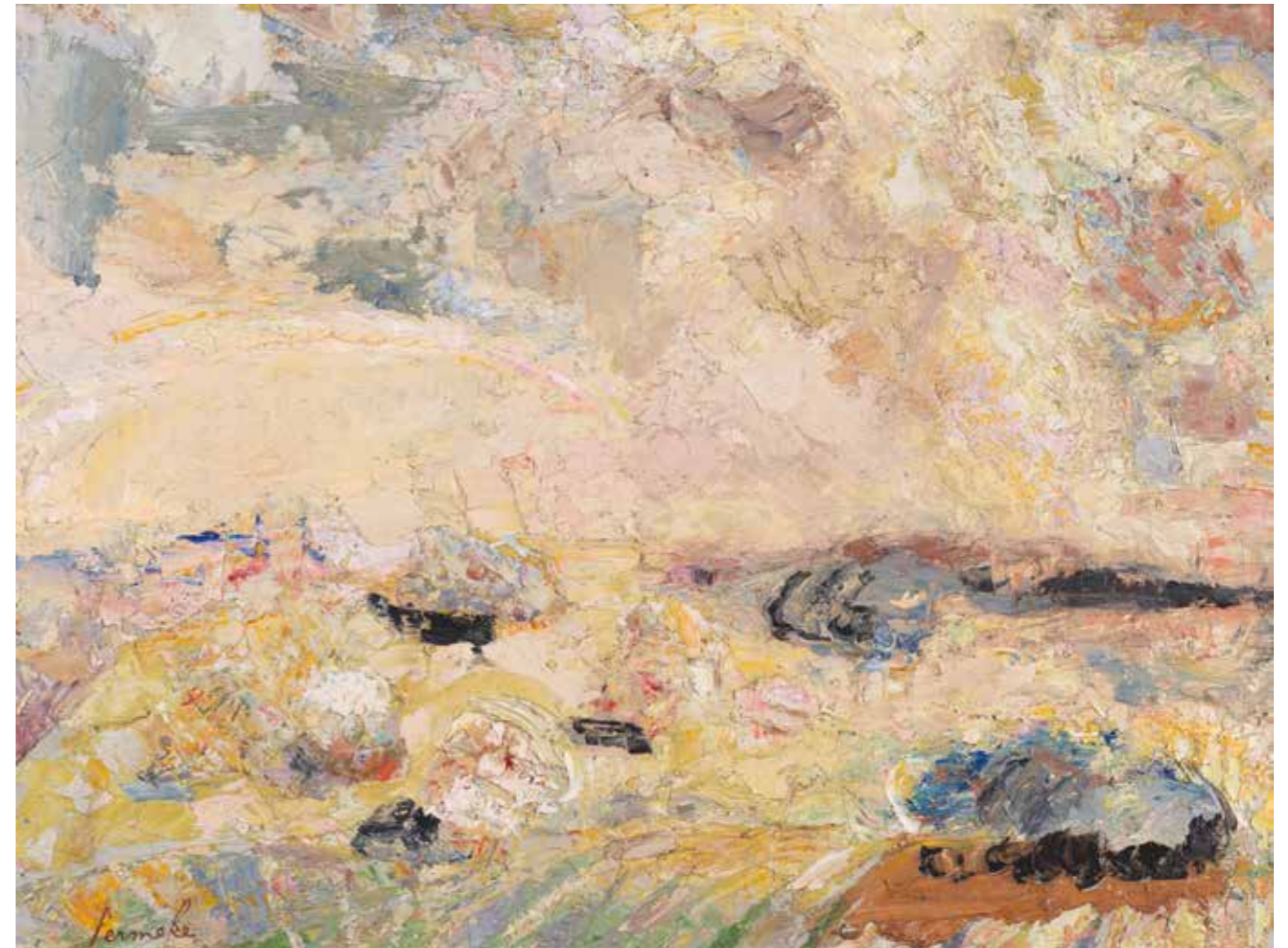
CAT. 22 Constant Permeke, Landschap in Devonshire , 1917, olieverf op paneel, 41,5 × 55 cm, Mu.ZEE-Permekemuseum inv. K002034, collectie Vlaamse Gemeenschap