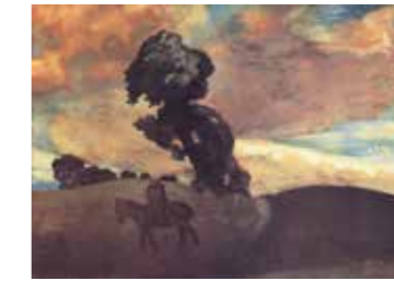
FIG. 37, p. 35

Gesigneerd onderaan links, titel op verso Galerie Oscar De Vos, Sint-Martens-Latem