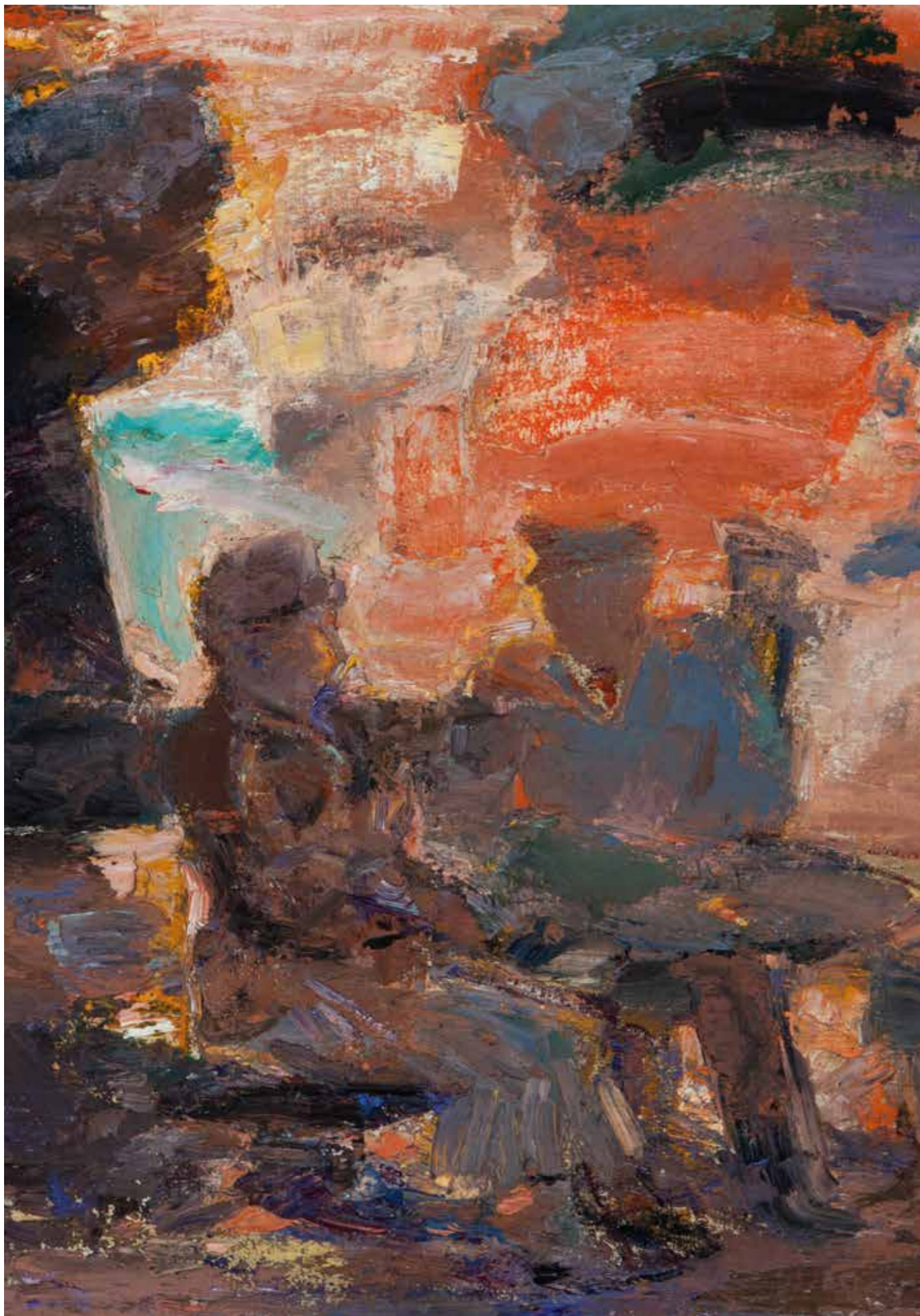
CAT. 9 Constant Permeke, Les Histories vraies (fragment), ca. 1916, olieverf op doek, 77 x 102 cm, Museum de Fundatie, Zwolle en Heino/Wijhe

Groot-Brittannië gaf aan veel Belgen die kansen. Dat was voor de Britten vanzelfsprekend: omdat de Duitsers de neutraliteit van België hadden geschonden – in de ochtend van 4 augustus 1914 vielen ze België binnen, terwijl hen nochtans verboden was het land te doorkruisen – verklaarden zij