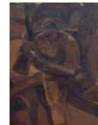
FIG. 42, p. 51

Gesigneerd onderaan rechts Koninklijk Museum voor Schone Kunsten Antwerpen, inv. 3118