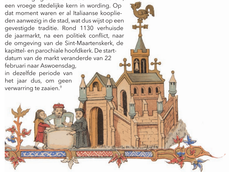
Illustratie 2: het controleren van de wol kwaliteit, A. Böhm, 1363 [kopie 1864] (Yper Museum, SM 002001)

Hoewel laken het hele jaar door in de Lakenhallen te koop was, werden de meeste deals tijdens de jaarmarkt gesloten, die een maand duurde. In die periode zakten internationale handelaars uit verschillende uithoeken af naar leper. De stad maakte deel uit van een jaarmarktencyclus en kwam tijdens de vasten als eerste aan de beurt, gevolgd door Brugge (Pasen), Torhout (juni), Rijsel (augustus) en Mesen (oktober). 8 De eerste vermelding van de jaarmarkt in leper dateert van 1127. Die ging door rond de Sint-Pieterskerk, een vroege stedelijke kern in wording. Op dat moment waren er al Italiaanse kooplieden aanwezig in de stad, wat dus wijst op een gevestigde traditie. Rond 1130 verhuisde de jaarmarkt, na een politiek conflict, naar de omgeving van de Sint-Maartenskerk, de kapittel- en parochiale hoofdkerk. De startdatum van de markt veranderde van 22 februari naar Aswoensdag, in dezelfde periode van het jaar dus, om geen verwarring te zaaien. 9